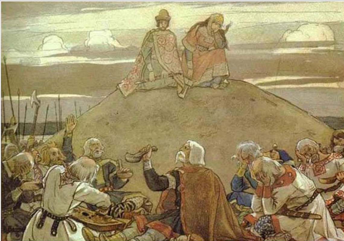
Художник: Васнецов В.