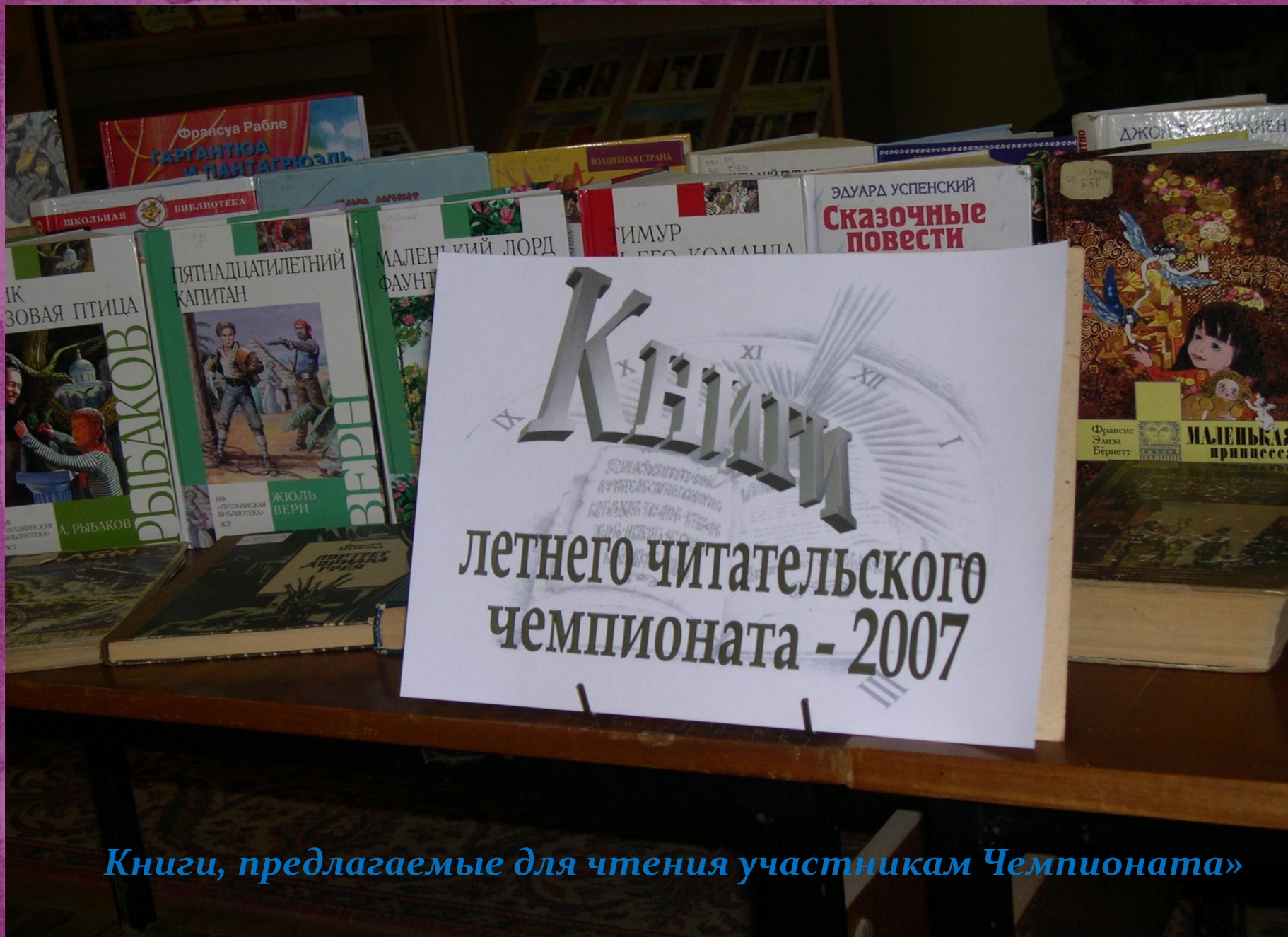
Книги, предлагаемые для чтения участникам Чемпионата»