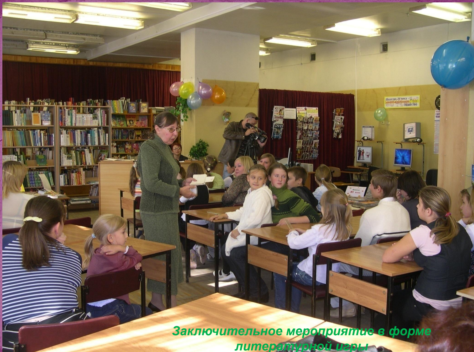
Заключительное мероприятие в форме литературной игры