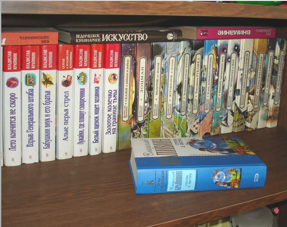
На книжной полке