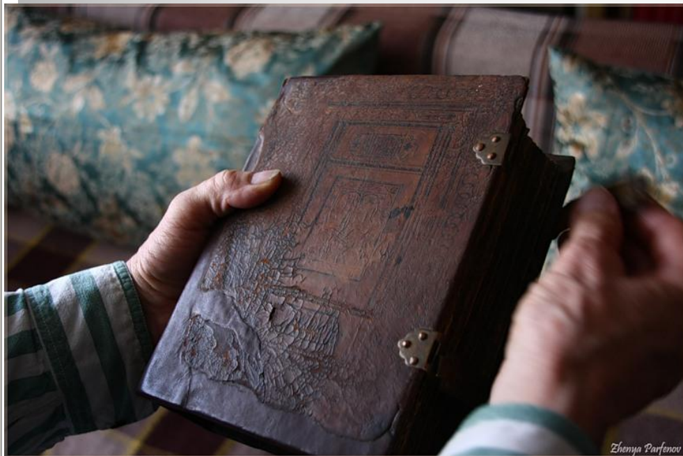
Книга с металлическими застёжками

Для особо ценных книг на переплёте укреплялись металлические застёжки.