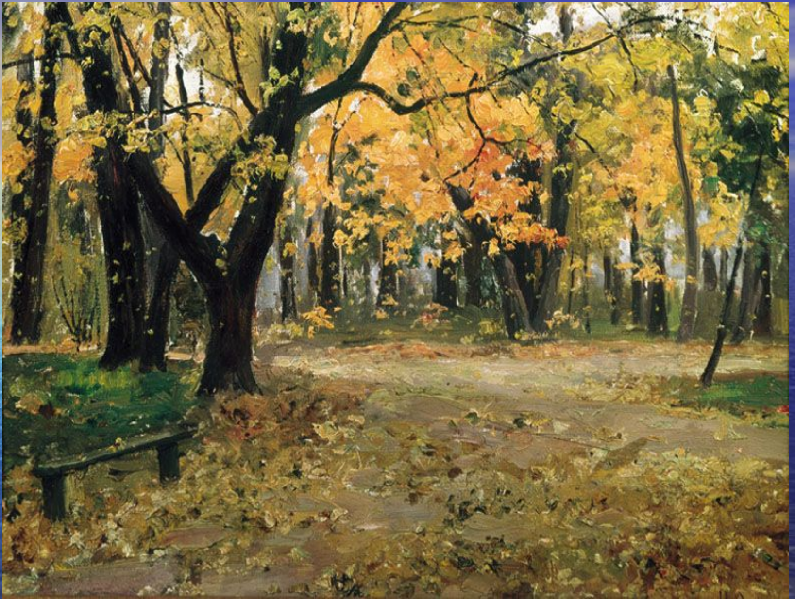
И. Остроухов. В Абрамцевском парке.