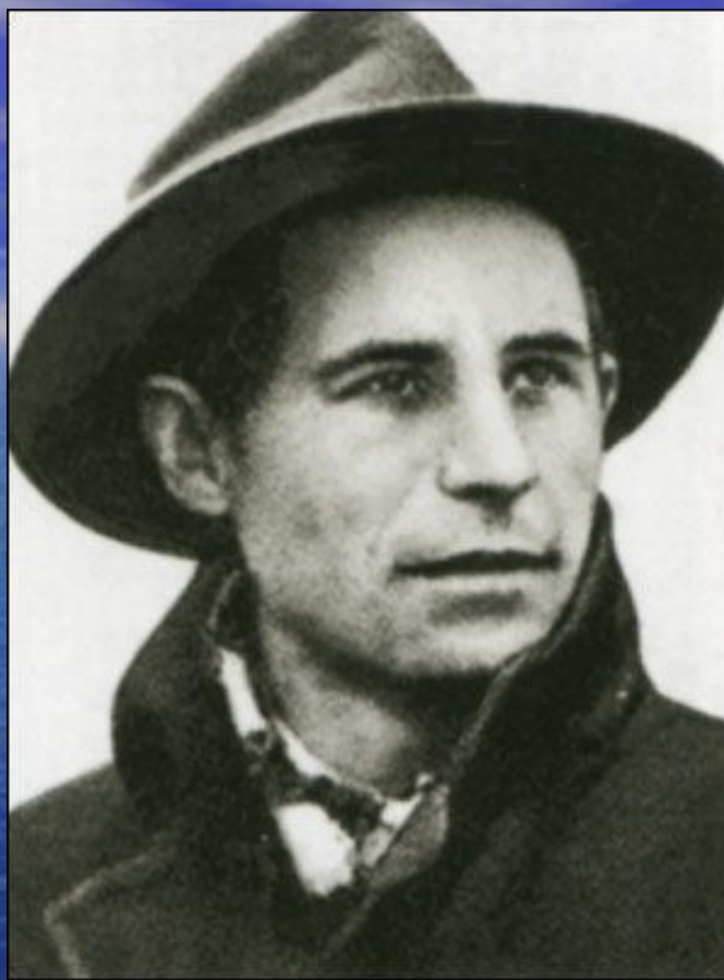
Н. М. Рубцов