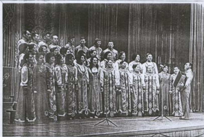
Хор жителей с. Малые Ялурь. 1973 г.