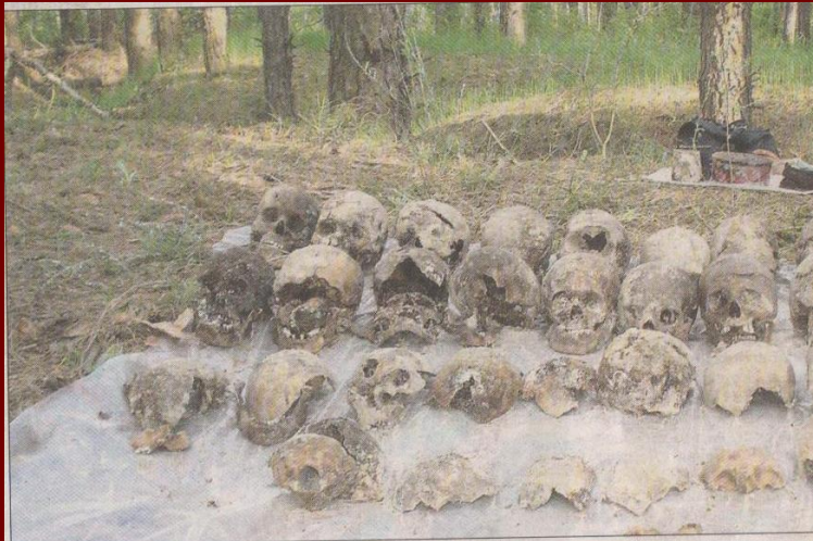
В годы политических репрессий были расстреляны тысячи воронежцев (фото сделано летом