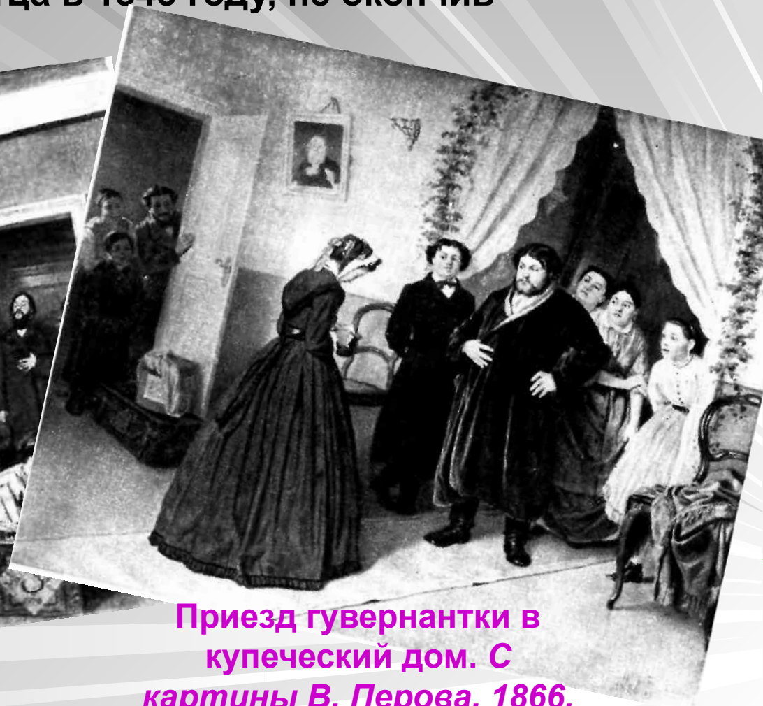
Приезд гувернантки в купеческий дом. С картины В. Перова. 1866.