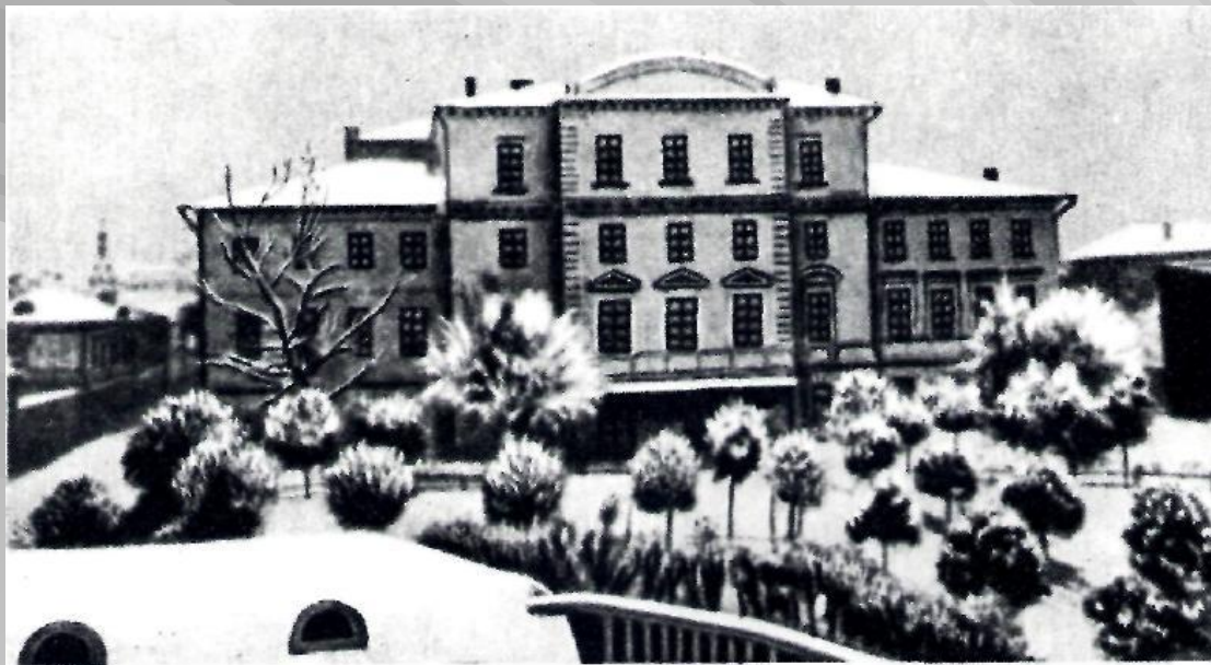
Первая московская гимназия, где учился А. Н. Островский.

Еще в гимназии он увлекается литературой, и первые опыты его литературного творчества относятся к гимназическому времени.