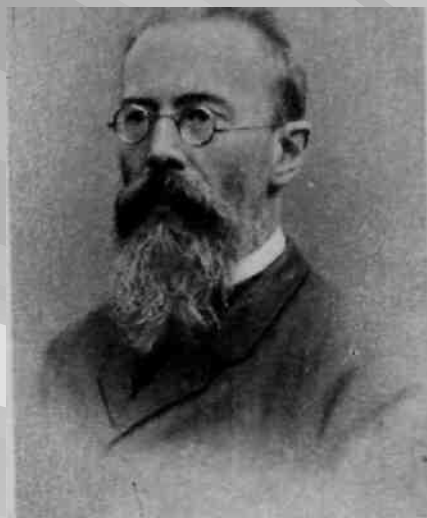
Композитор Н. А. Римский-Корсаков. 1900