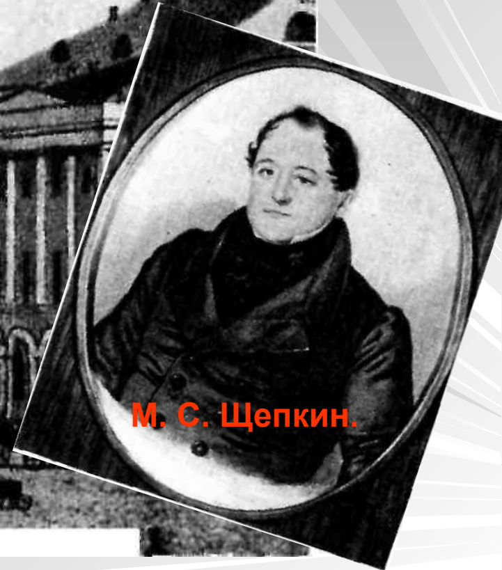
М. С. Щепкин.