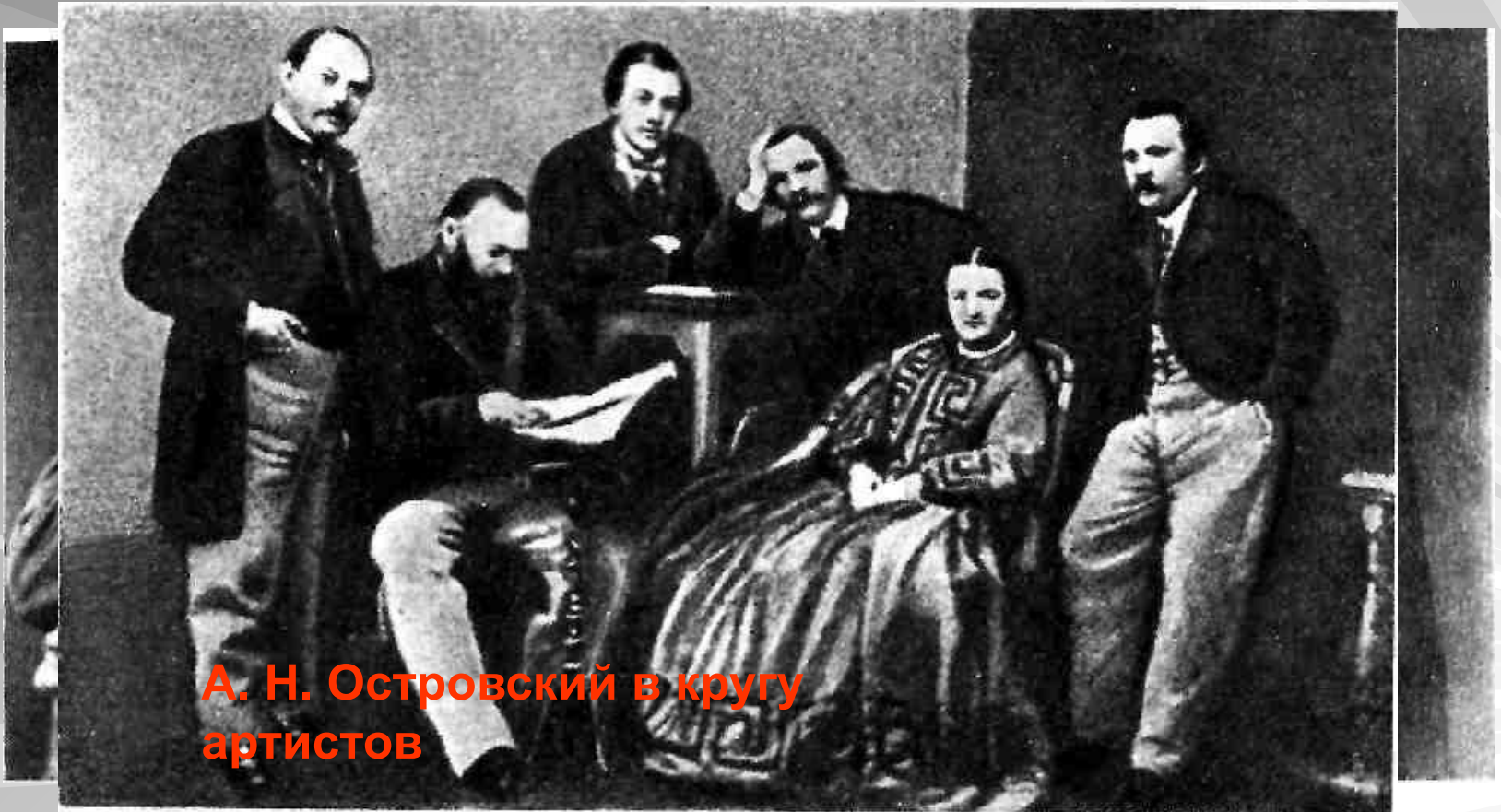
А. Н. Островский в кругу артистов

Считая специальную подготовку воспитания и обучения актера «делом государственной важности», А. Н. Островский в 1865 году вместе с композитором Н. Г. Рубинштейном организует Артистический кружок. Кружок дал русскому театру М. П. Садовского, О. О. Садовскую, В. А. Макшеева. Здесь «впервые познакомилась московская публика с огромным талантом П. А. Стрепетовой».