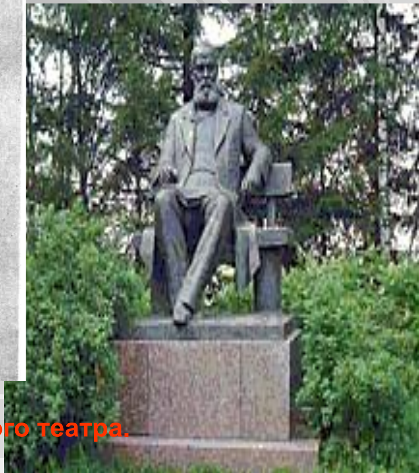
Памятник А.Н, Островскому у Малого театра. Скульптор А.Андреев