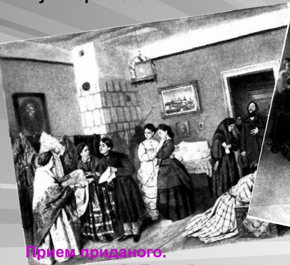
Прием приданого. С картины В. Пукирёва.

А. Н. Островский, с детства наблюдавший жизнь купцов, в совершенстве изучил быт, семейные и имущественные отношения их во время почти восьмилетней службы в Московском совестном, а затем Коммерческом суде, куда поступил по настоянию отца в 1843 году, не окончив университета