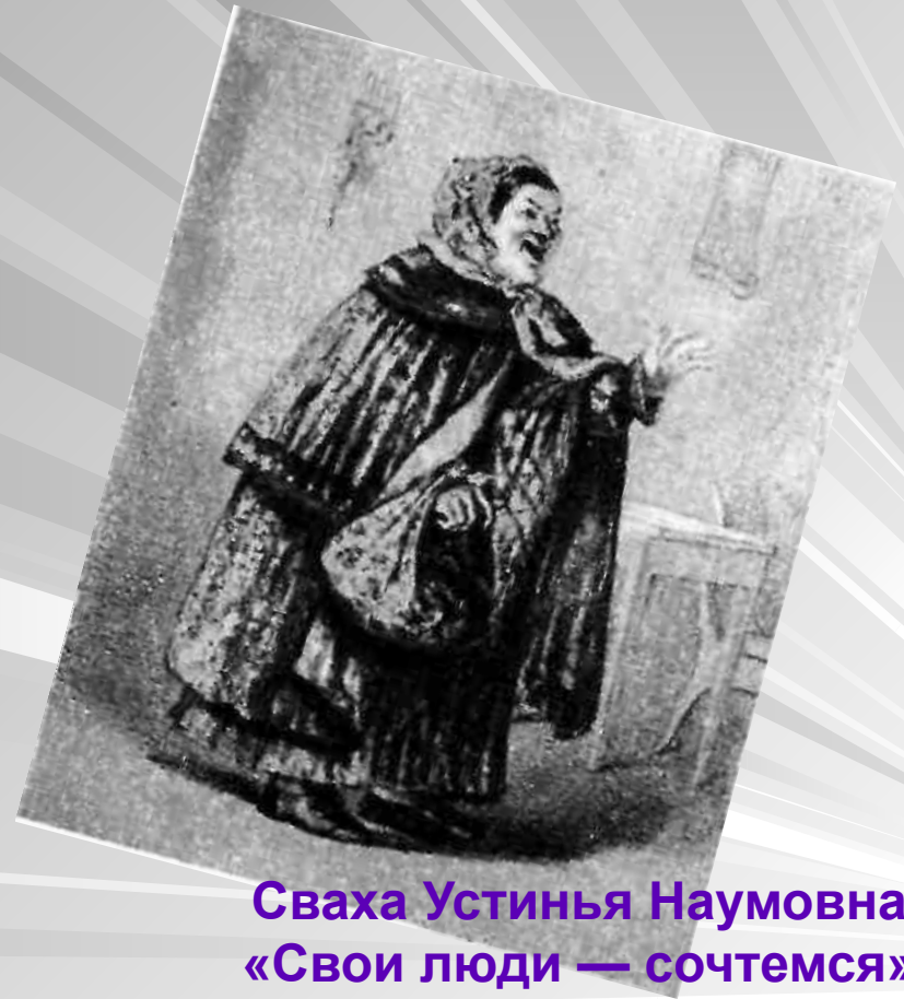
Сваха Устинья Наумовна. «Свои люди — сочтемся». С рисунка Я. Боклевского. 1859.