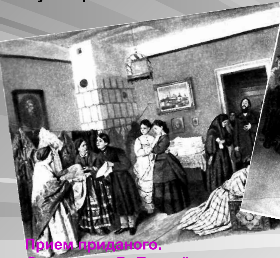
Прием приданого. С картины В. Пукирёва.

А. Н. Островский, с детства наблюдавший жизнь купцов, в совершенстве изучил быт, семейные и имущественные отношения их во время почти восьмилетней службы в Московском совестном, а затем Коммерческом суде, куда поступил по настоянию отца в 1843 году, не окончив университета