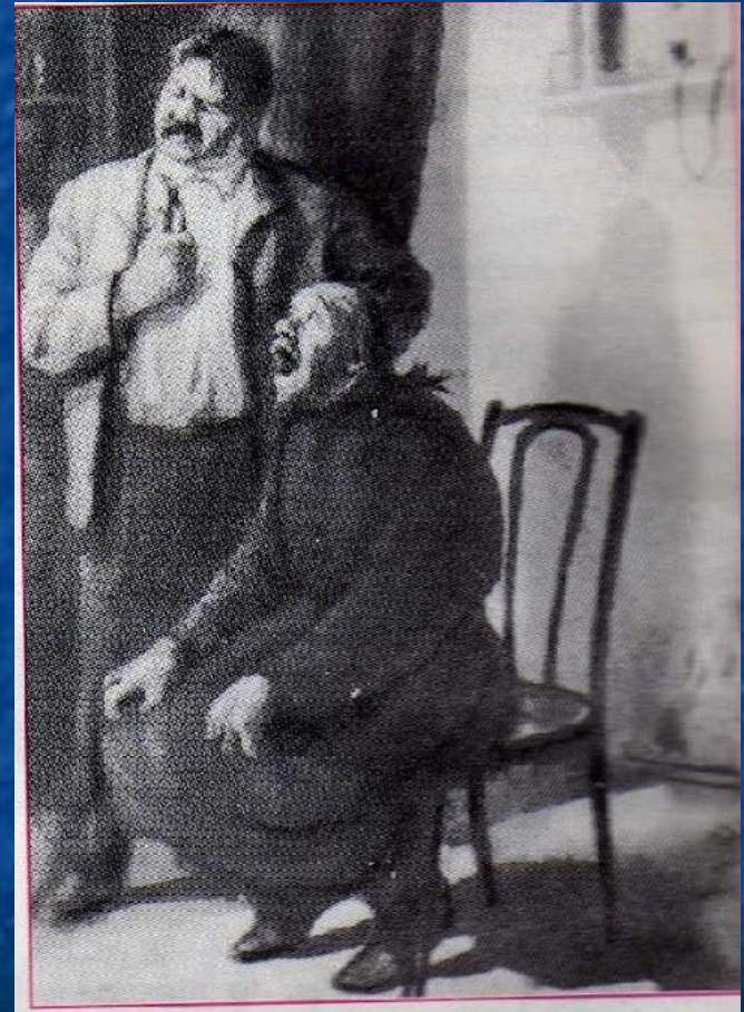
«Хирургия». Иллюстрация Кукрыниксов

краткость фразы; простые предложения; отсутствие эпитетов; глагол – любимая часть речи; точность каждого слова.