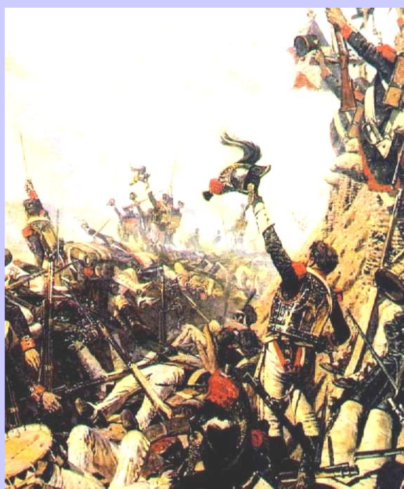
В.Верещагин.Конец Бородинского сражения

27 августа в 2 часа ночи Кутузов приказал отвести войска. Сражение не принесло победы ни одной из сторон. Французы потеряли 60 тыс. солдат, но за ними осталось поле боя. Русские-40 тыс, но они вынуждены были продолжить отступление.