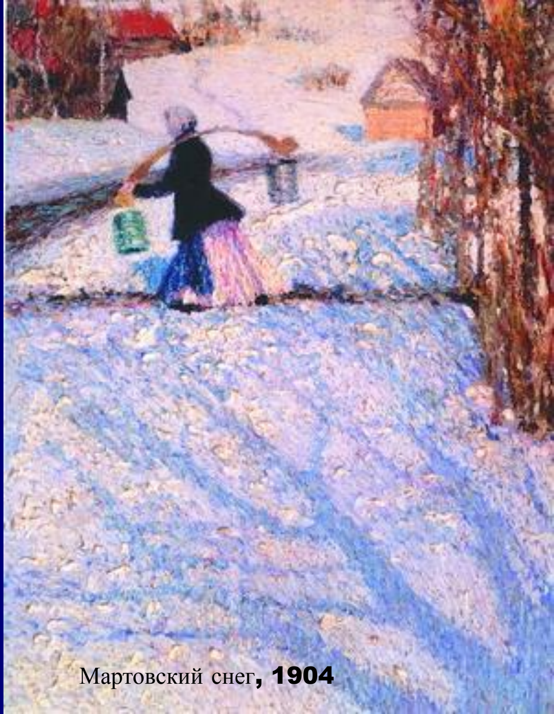
Мартовский снег, 1904