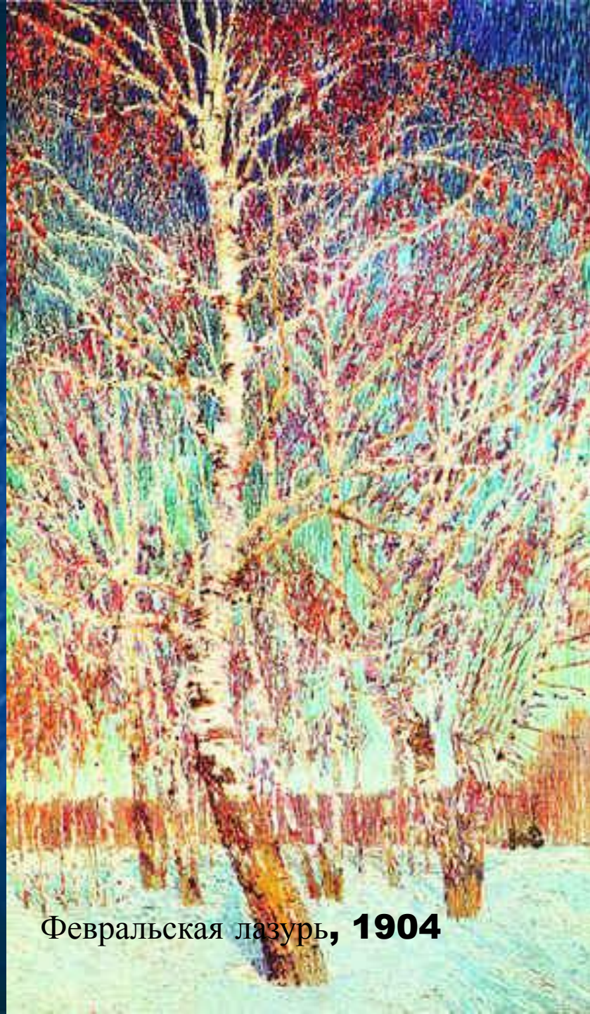
Февральская лазурь, 1904