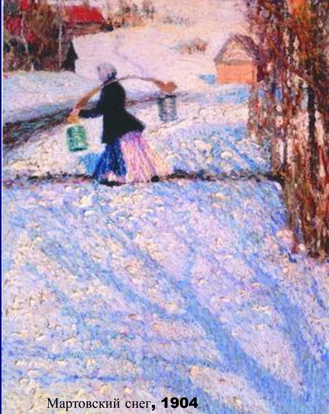
Мартовский снег, 1904