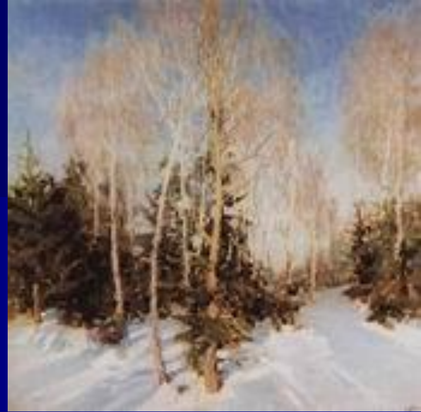
Зимний пейзаж, 1954

Пейзаж... Природа... Порой мы даже не замечаем той красоты, среди которой живем. Искусство пейзажа напоминает нам об этом. Каждый настоящий художник-пейзажист, внося в картину свое отношение к природе, как бы приглашает нас пристальнее взглянуть в нее и насладиться ею. А может, и пообщаться с ней. Не надо думать, что природа — это нечто неподвижное и молчаливое. Ведь не случайно поэт Федор Тютчев писал: