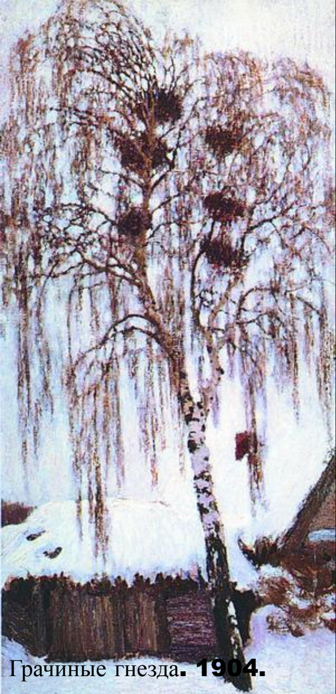
Грачиные гнезда. 1904.