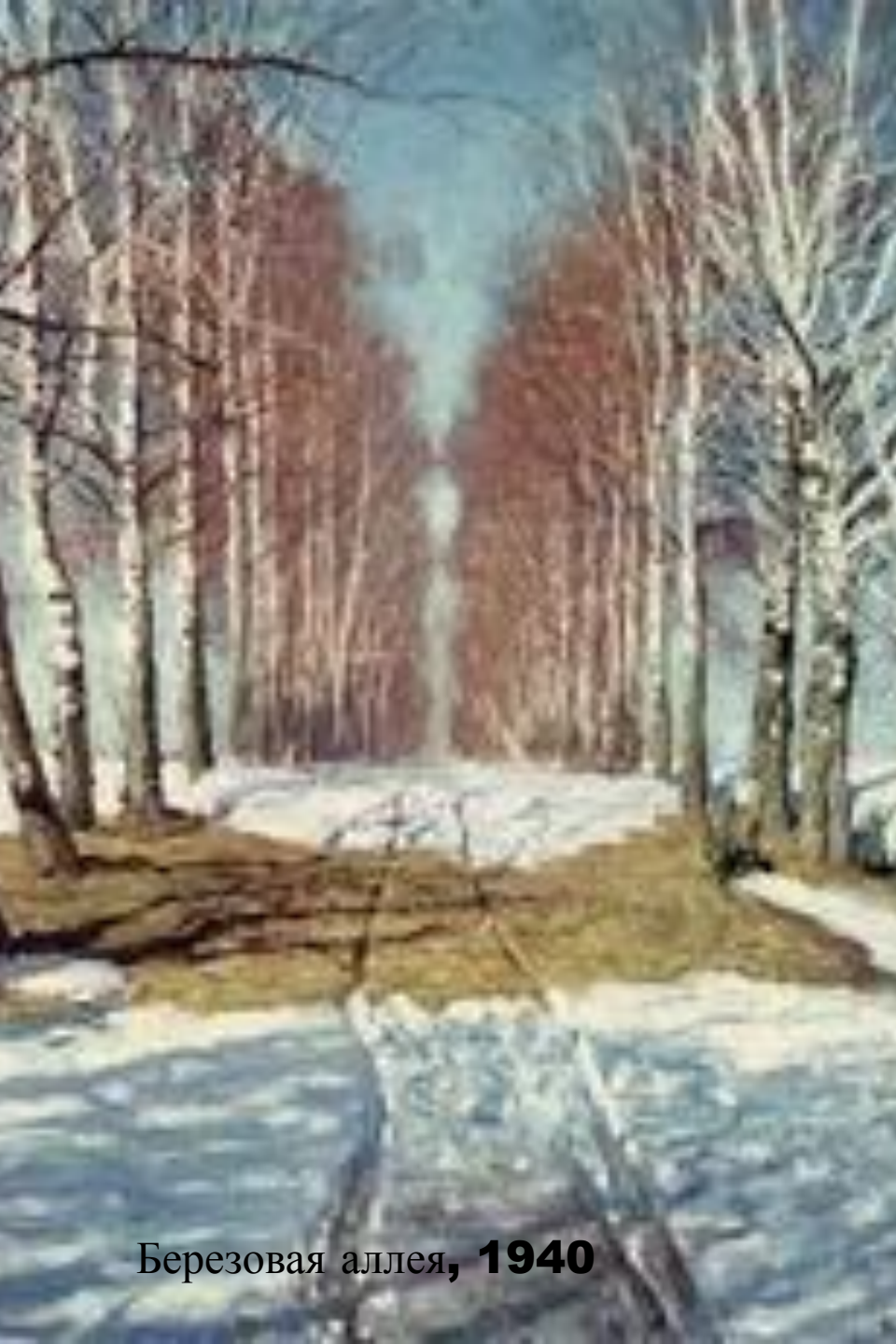
Березовая аллея, 1940