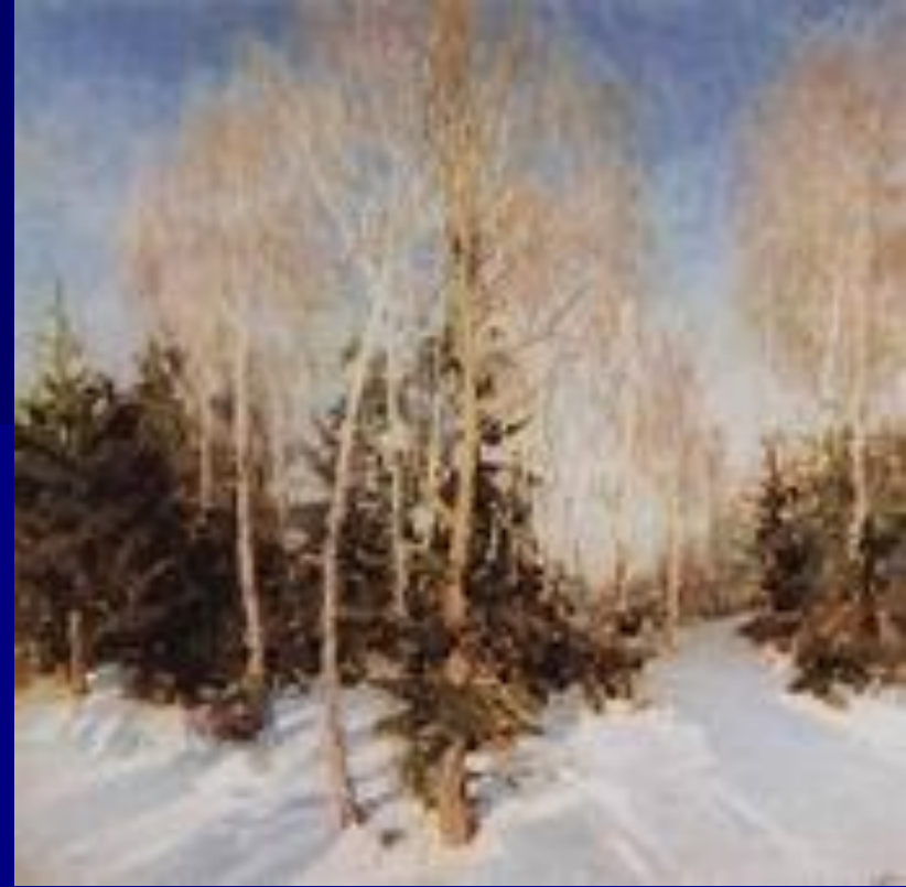
Зимний пейзаж, 1954

Пейзаж... Природа... Порой мы даже не замечаем той красоты, среди которой живем. Искусство пейзажа напоминает нам об этом. Каждый настоящий художник-пейзажист, внося в картину свое отношение к природе, как бы приглашает нас пристальнее взглянуть в нее и насладиться ею. А может, и пообщаться с ней. Не надо думать, что природа — это нечто неподвижное и молчаливое. Ведь не случайно поэт Федор Тютчев писал: