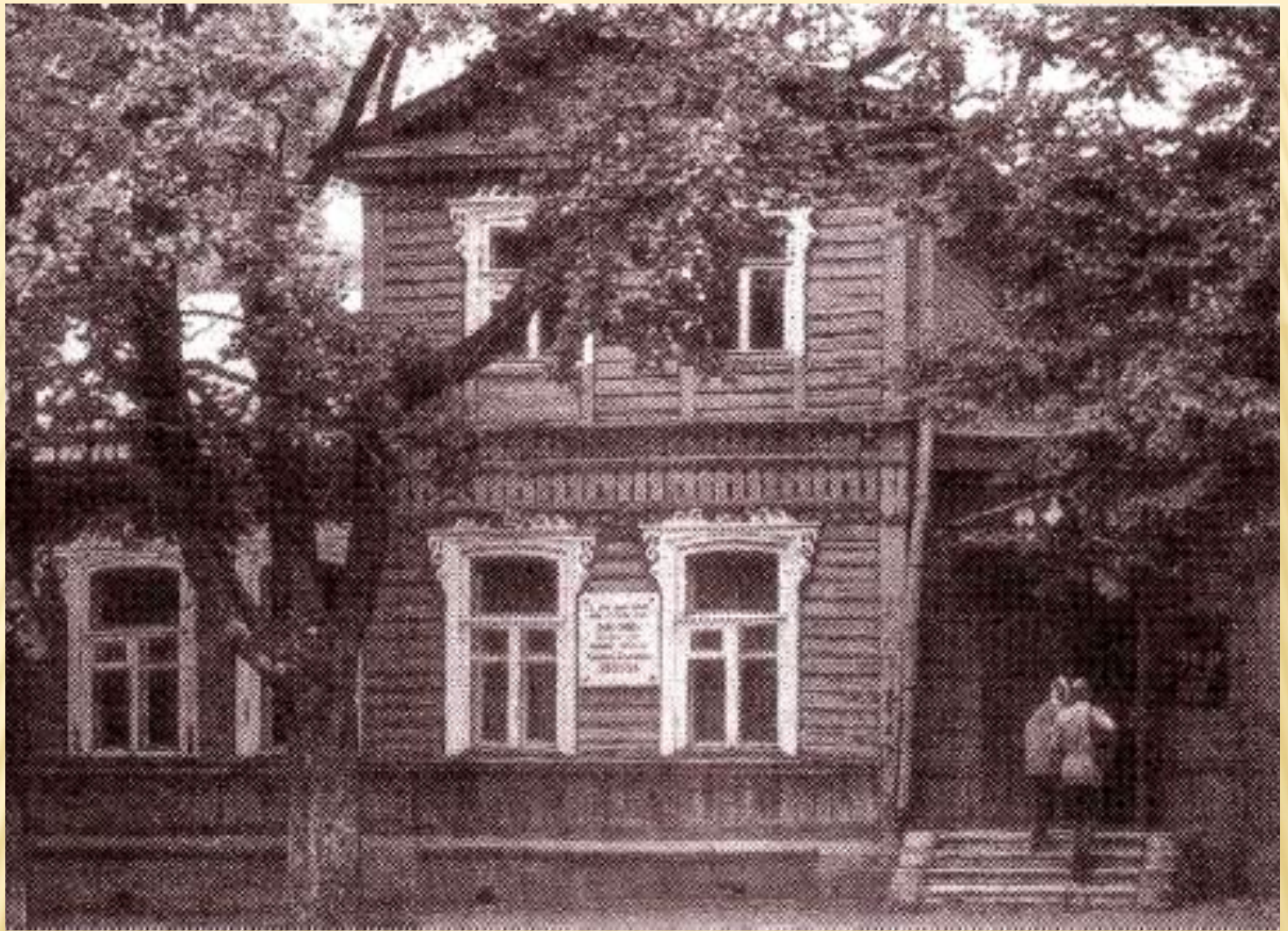
Дом-музей Н.С.Лескова в Орле.