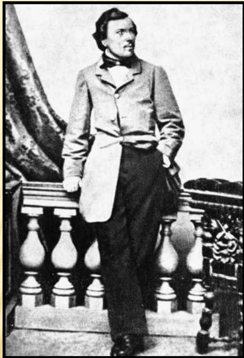
Н.С.Лесков Санкт-Петербург, 1860г.