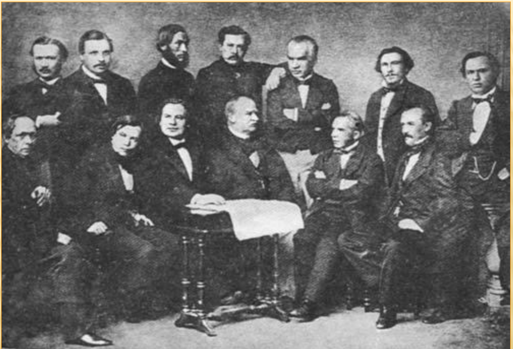
Литературное общество «Северная пчела»