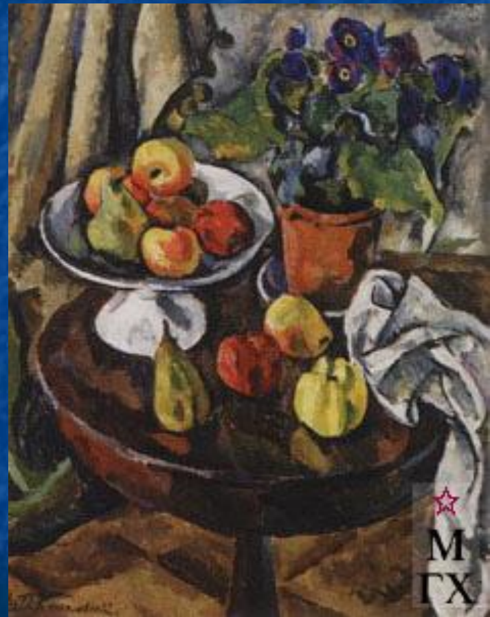
Натюрморт. Фрукты. 1911. Х.М. 73x58 см. Астраханская обл. картинная гал. им. Б.М. Кустодиева, Астрахань