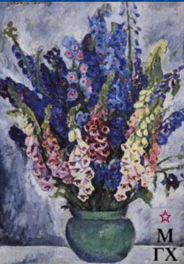
Цветы. Дигиталис. 1910. Х.М. 64x42 см. Нац.галерея Армении, Ереван

Натюрморт - картина с изображением крупным планом предметов: цветов, плодов, битой дичи, рыбы, утвари.