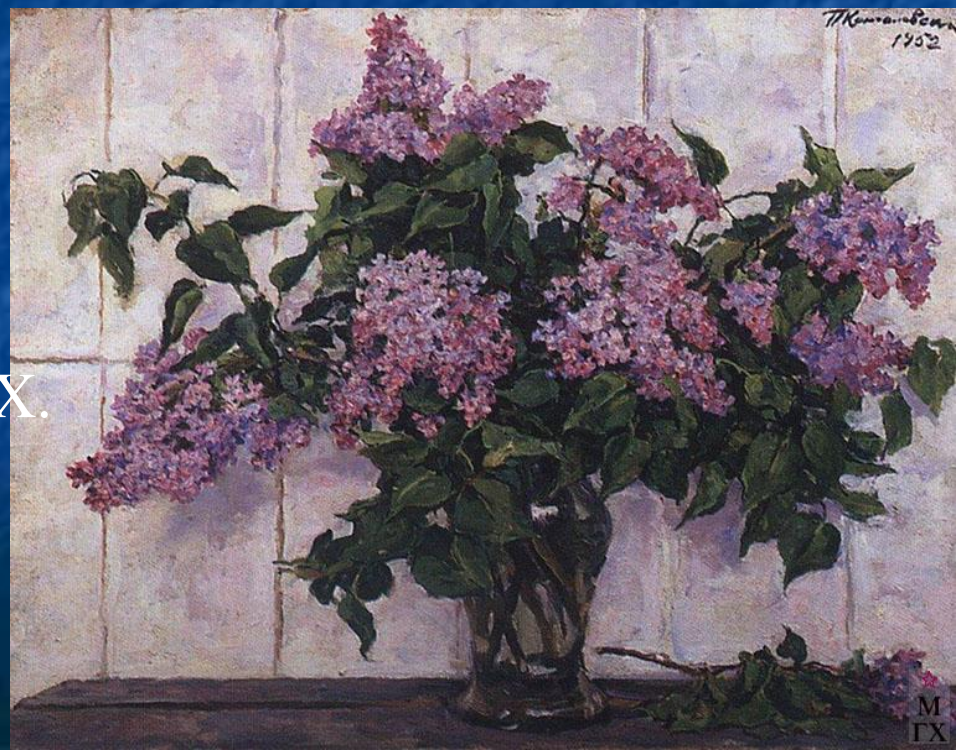
Сирень в стеклянной банке. 1952. Х. М. 74x92. Музей изобразительных искусств Республики Карелия, Петрозаводск.