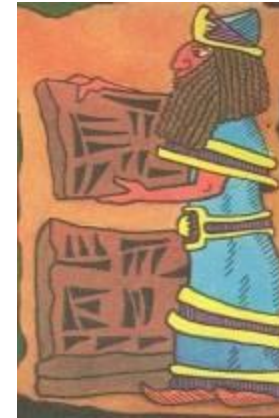
Письма на глине