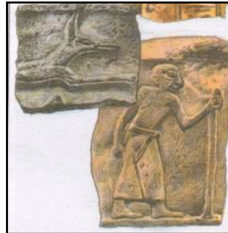
Письма в картинках