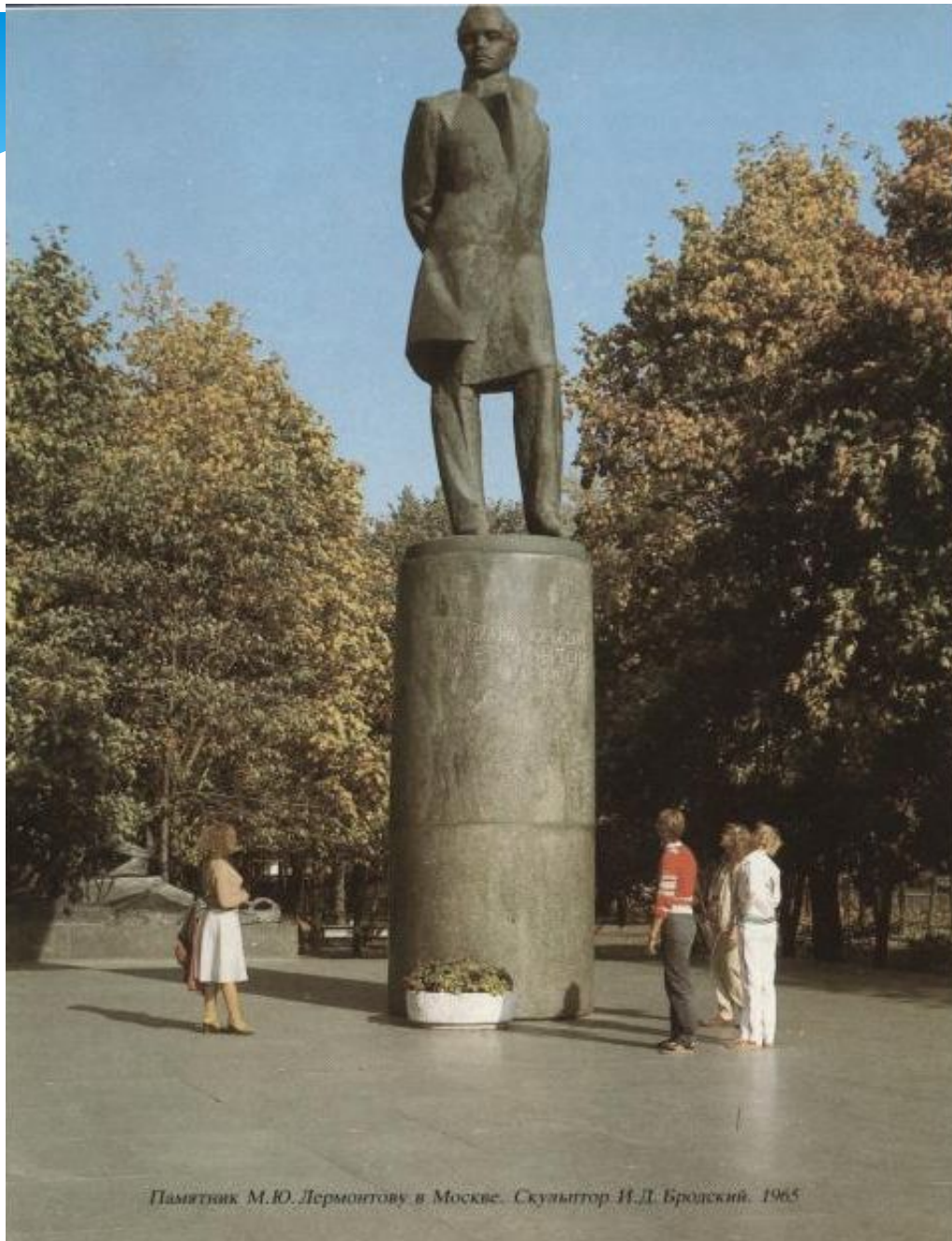
Памятник М.Ю. Лермонтову в Москве. Скульптор И.Д. Бродский. 1965

Памятник М. Ю. Лермонтову в Москве. Скульптор И. Д. Бродский. 1965