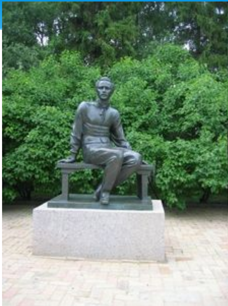
Памятник М. Ю. Лермонтову в Тарханах