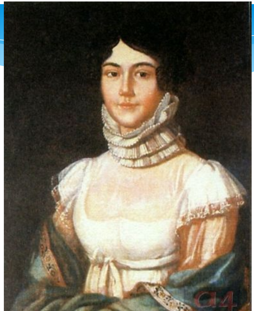
Мария Михайловна Лермонтова, мать поэта. Неизвестный художник. 1810-е

По материнской линии М. Лермонтов происходил из известного в России и богатого дворянского рода