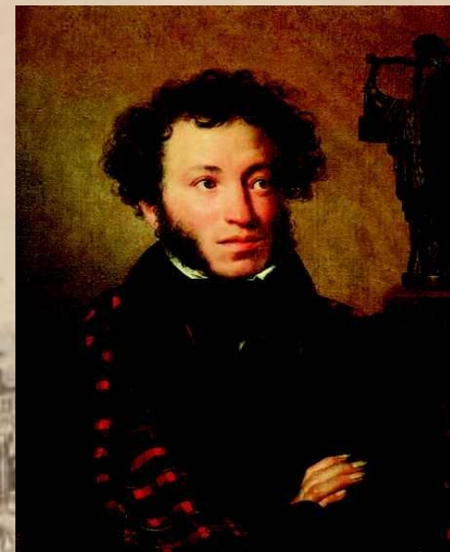
А.С. Пушкин «Евгений Онегин»