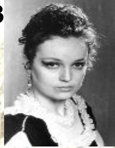
3) Евгений Онегин