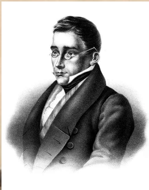
А.С. Грибоедов «Горе от ума»