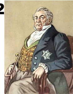
2) Александр Чацкий