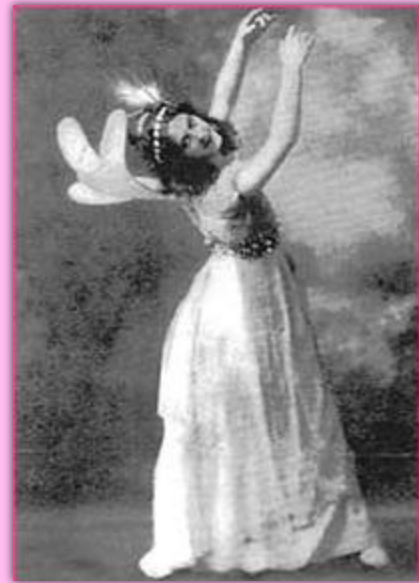
На американской танцовщице Айседоре Дункан