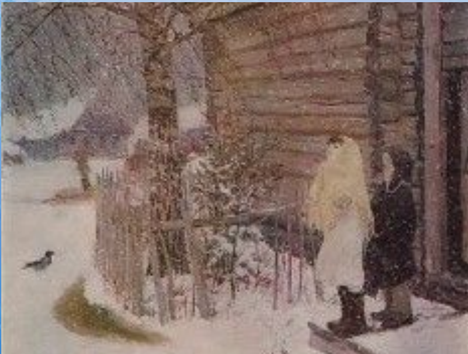
А. А. Пластов «Первый снег». 1946 Холст, масло. Калининская областная картинная галерея.