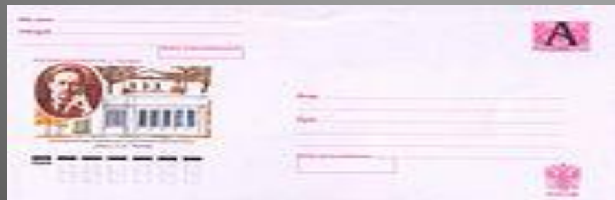
Почтовый конверт России, 2004 год