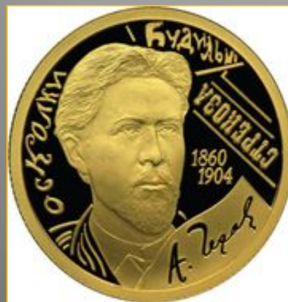
50 рублей из золота