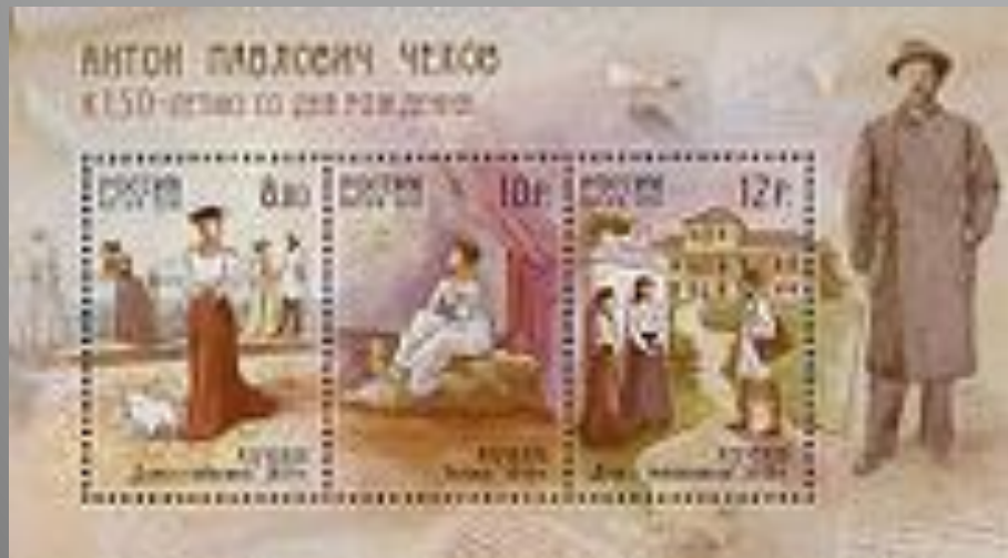
Почтовый блок России, 2010 год: произведения А. П. Чехова