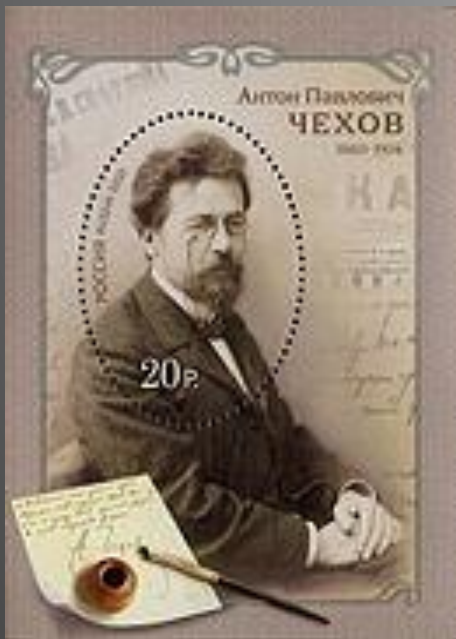
Почтовый блок России к 150-летию со дня рождения А. П. Чехова