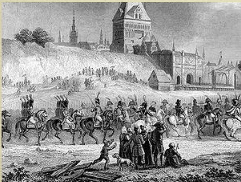
битва под Гейльсбергом