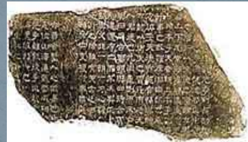
Каменный штамп для печати (Китай, 179 г.)

Это, например, были буддийские изречения, вырезанные на мраморных колоннах буддийских храмов. Легенды гласят, что паломники смачивали выступающие части букв краской, а затем прикладывали к ним увлажненные листы бумаги.