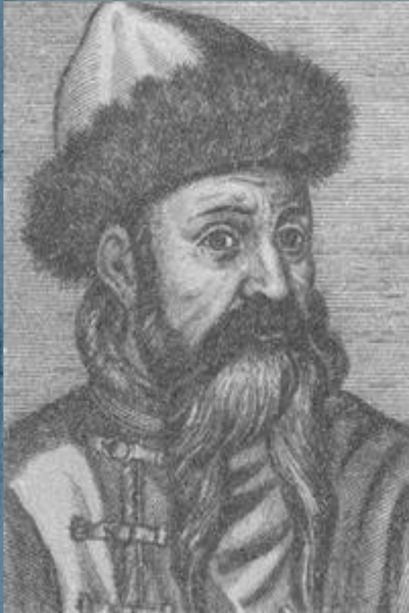
Иоганн Гутенберг (1400-1468 гг.)

В Западной Европе книгопечатание возникло в конце XIV — начале XV в. В этот период закладывались основы мировой торговли, перехода от ремесла к мануфактуре и старый, рукописный способ размножения книг уже не мог удовлетворить растущих потребностей. Он заменяется книгопечатанием. Вначале в Европе появился способ печатания с досок, на которых вырисовывались изображения и текст. Таким способом был напечатан ряд книг, игральные карты, календари и т. д.