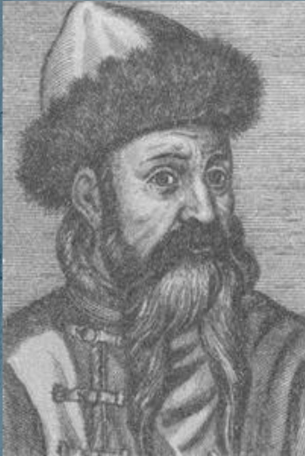
Иоганн Гутенберг (1400-1468 гг.)

В Западной Европе книгопечатание возникло в конце XIV — начале XV в. В этот период закладывались основы мировой торговли, перехода от ремесла к мануфактуре и старый, рукописный способ размножения книг уже не мог удовлетворить растущих потребностей. Он заменяется книгопечатанием. Вначале в Европе появился способ печатания с досок, на которых вырисовывались изображения и текст. Таким способом был напечатан ряд книг, игральные карты, календари и т. д.