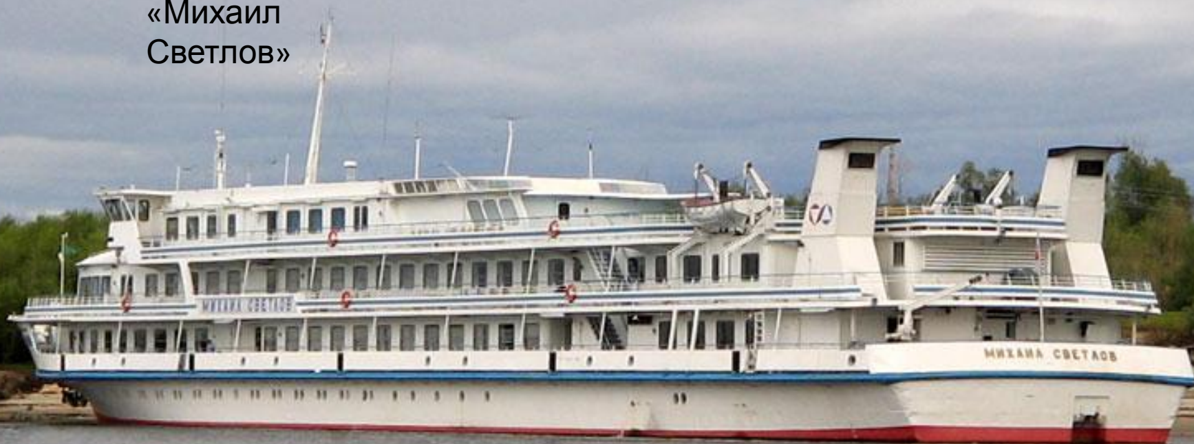
Теплоход «Михаил Светлов»