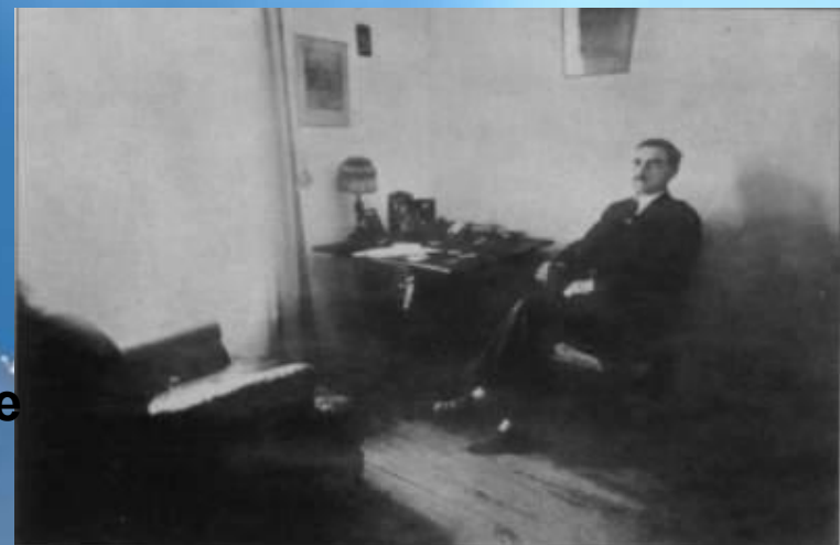
А.С.Грин в рабочем кабинете. Феодосия, 1926 г.

Среди произведений - стихотворения, поэмы, сатирические миниатюры, басни, очерки, новеллы, рассказы, повести, романы: "Случай" (1907, рассказ), "Апельсины" (1908, рассказ), "Остров Рено" (1909, рассказ), "Колония Ланфиер" (1910, рассказ), "Зимняя сказка" (1912, рассказ), "Четвертый за всех" (1912, рассказ), "Проходной двор" (1912, рассказ), "Зурбаганский стрелок" (1913, рассказ), "Капитан Дюк" (1915, рассказ), "Алые паруса" (1916, опубликована 1923, повесть-феерия), "Пешком на революцию" (1917, очерк), "Восстание", "Рождение грома", "Маятник души", "Корабли в Лиссе" (1918, опубликован 1922, рассказ), "Крысолов" (опубликован 1924, рассказ на тему послереволюционного Петрограда), "Сердце пустыни" (1923), "Блистающий мир" (1923, опубликован 1924, роман), "Фанданго" (опубликован 1927, рассказ на тему послереволюционного Петрограда), "Бегущая по волнам" (1928, роман), "Ветка омелы" (1929, рассказ), "Зеленая лампа" (1930, рассказ), "Перед занавесом" (1930, роман)