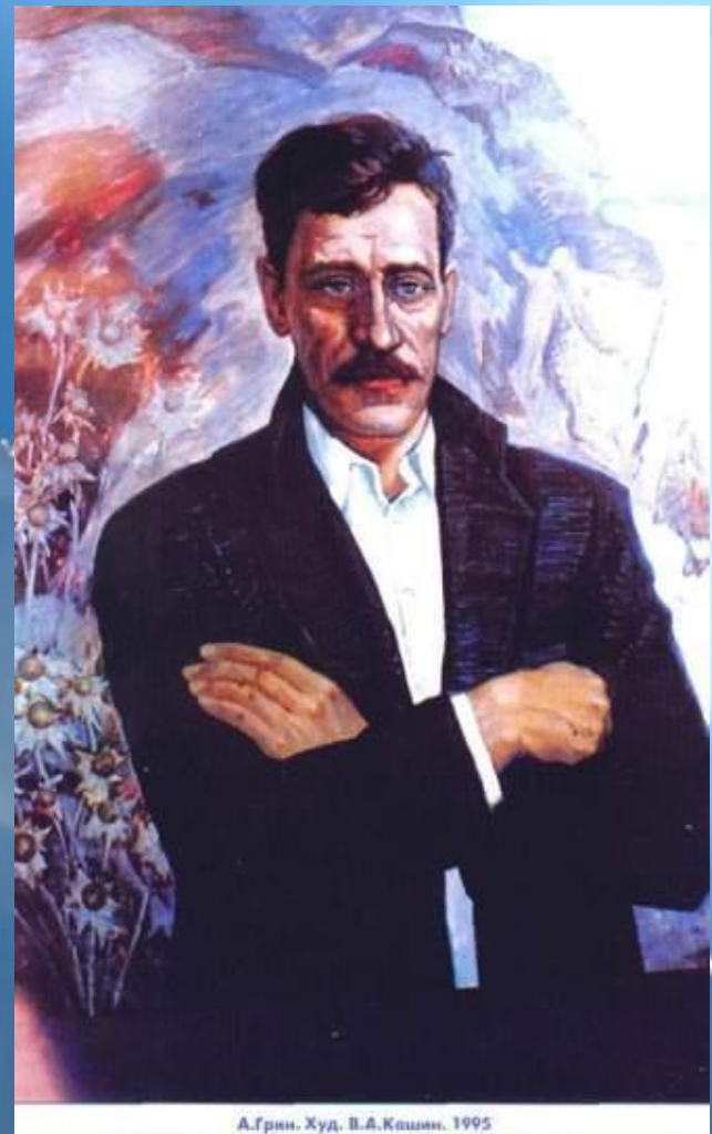
А.Грин. Худ. В.А.Кашин. 1995