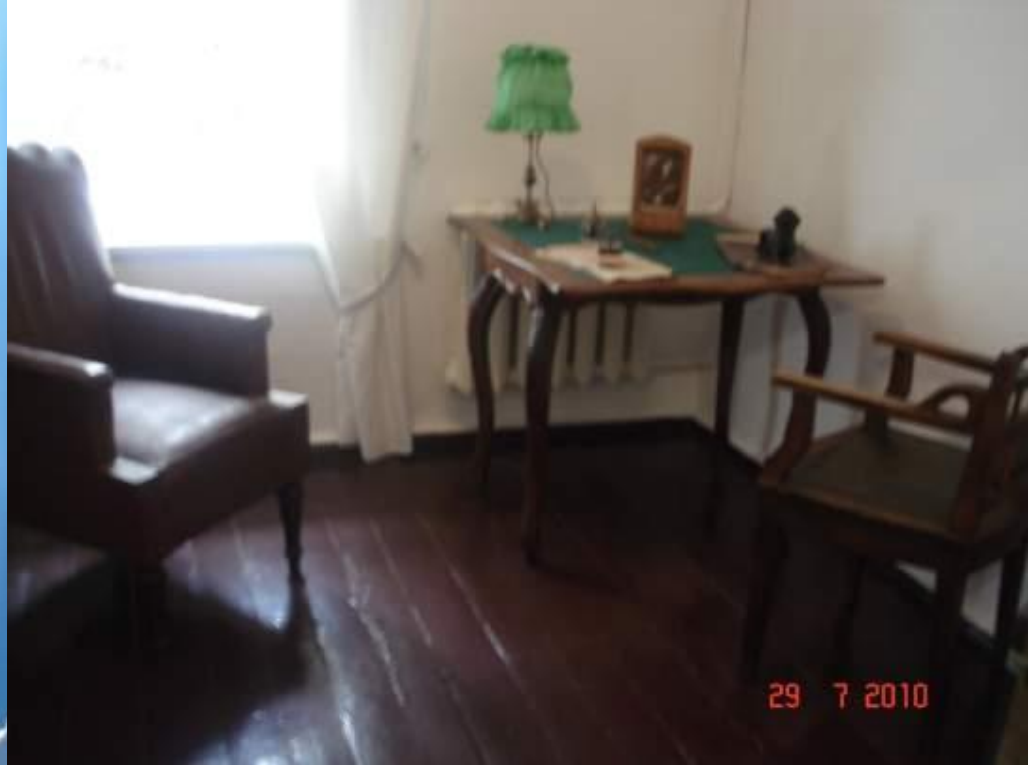
Рабочий кабинет писателя