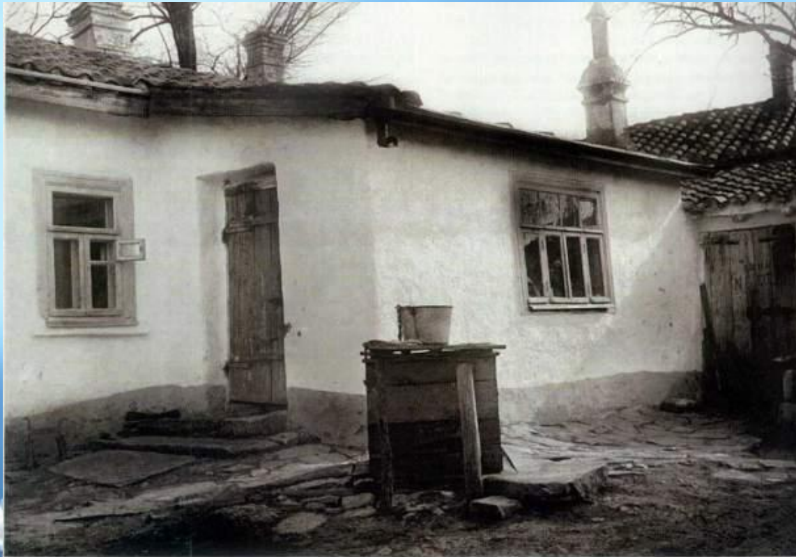
Дом-музей Александра Грина в Старом Крыму

Закончив роман "Блистающий мир", весной 1923 года Грин едет в Крым, к морю, бродит по знакомым местам, живет в Севастополе, Балаклаве, Ялте, а в мае 1924 года поселяется в Феодосии - "городе акварельных тонов". В ноябре 1930 года, уже больной, он переезжает в Старый Крым.