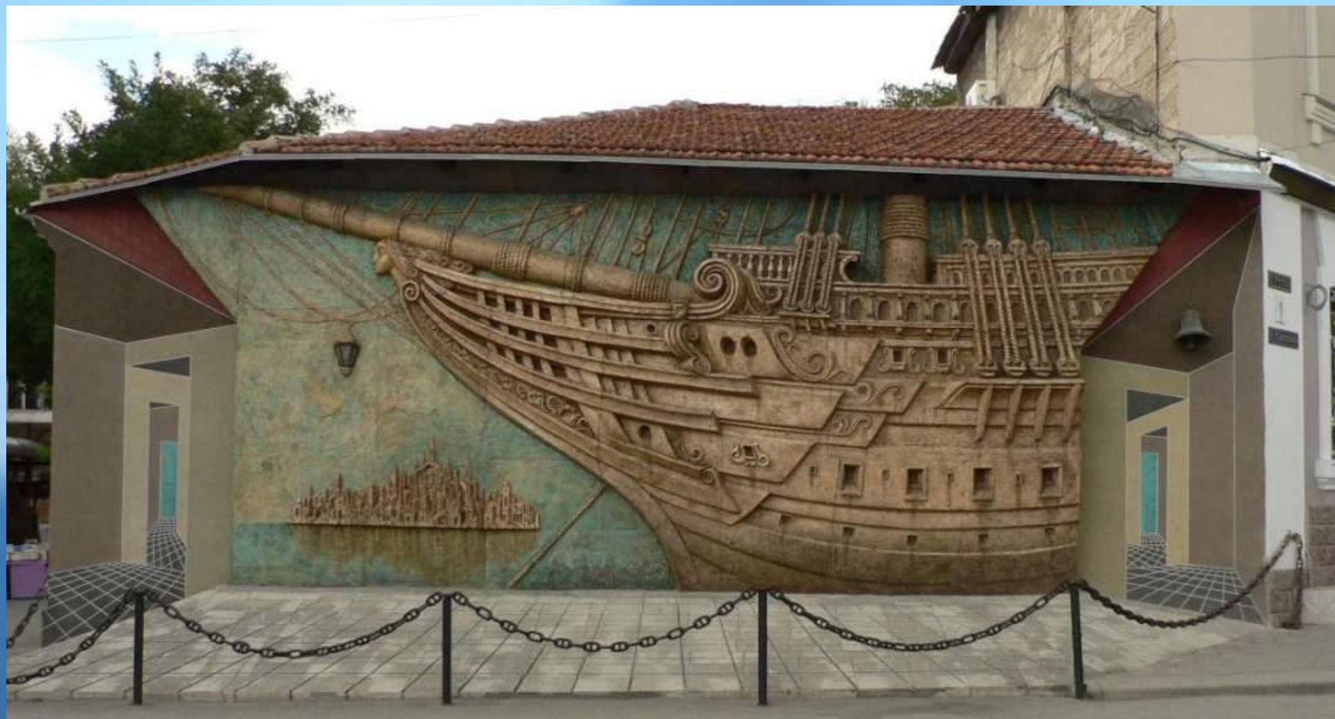
Стена дома Грина