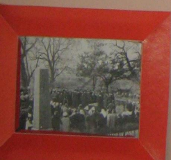
Порядочно-траурный митинг при захоронении останков героев