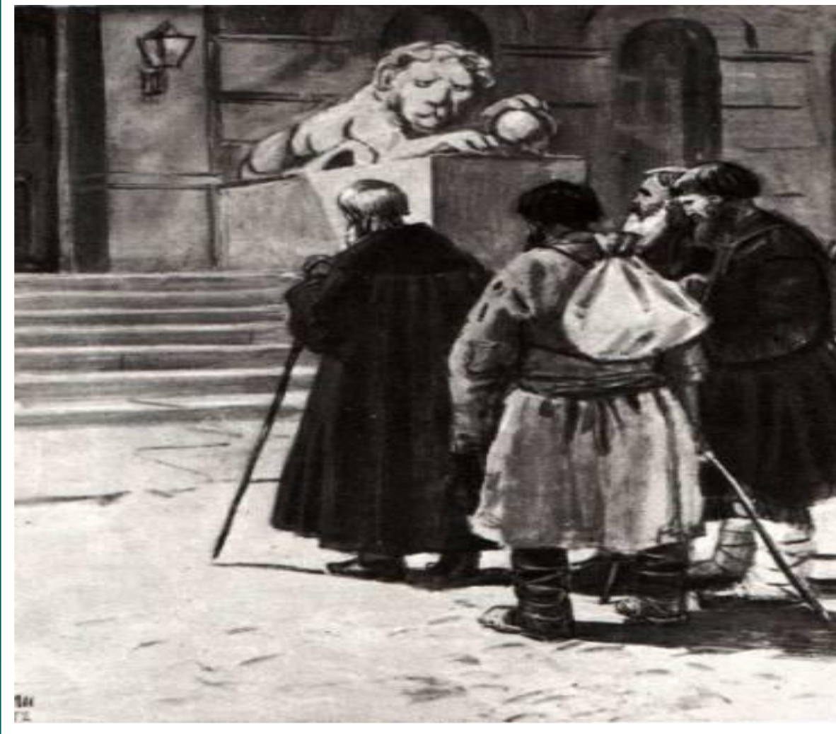
Иллюстрация Д.А. Шмаринова к стихотворению «Размышления у парадного подъезда»