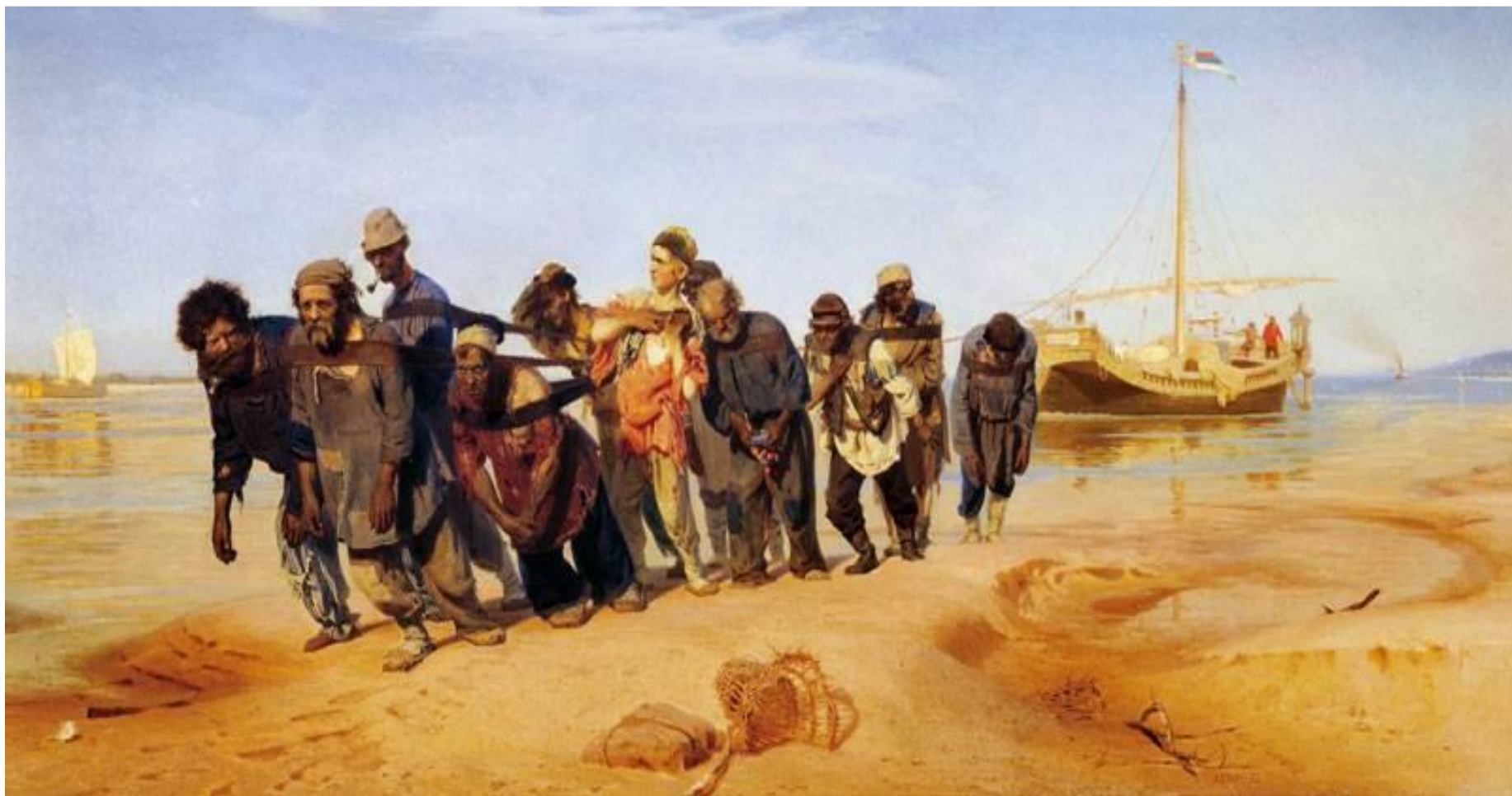
И.Е. Репин «Бурлаки на Волге»