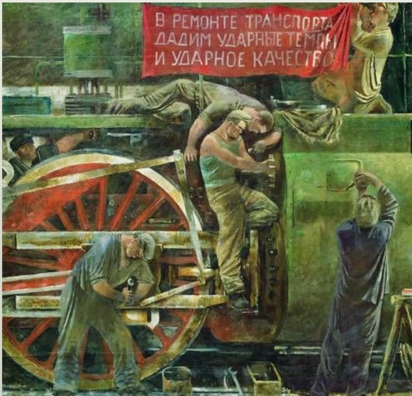
А.Самохвалов. Ремонт паровоза. 1931 г.