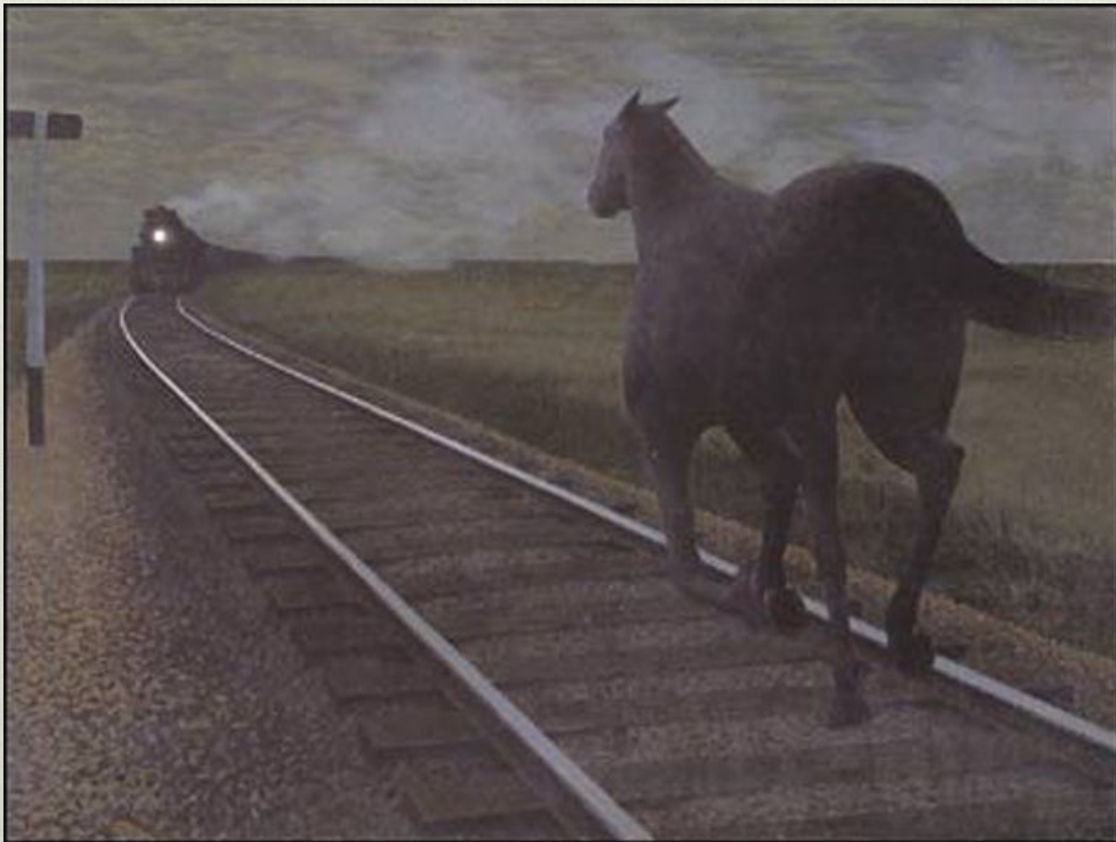
А. Колвиль. Лошадь и поезд