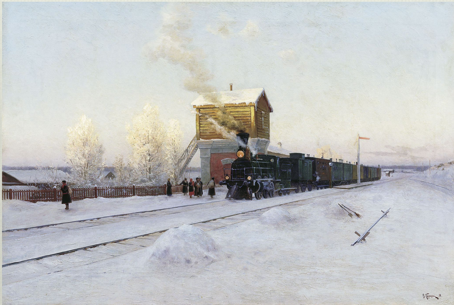
В.Казанцев. На полустанке. Зимнее утро на Уральской железной дороге. 1891 г.