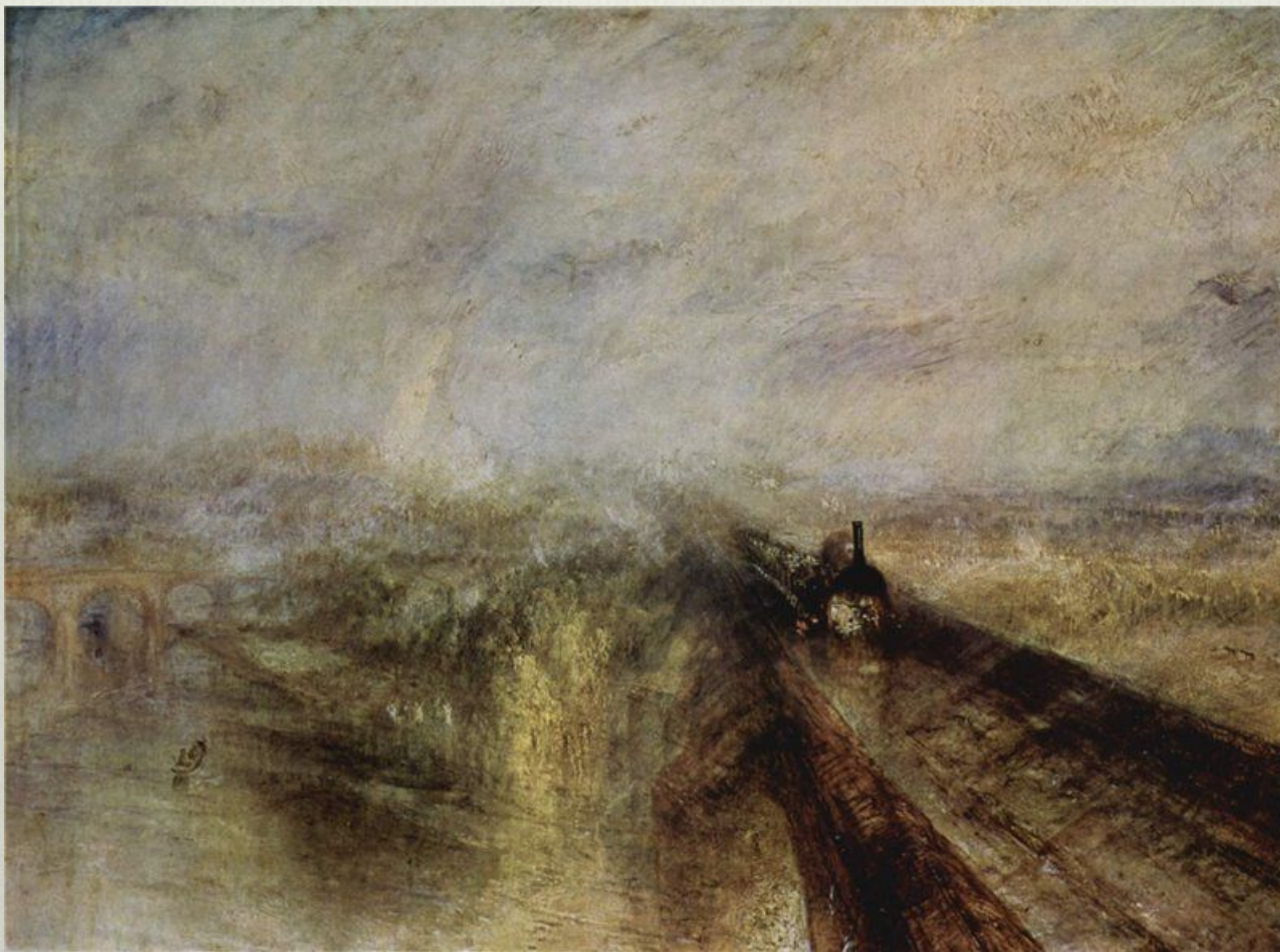
У. Тёрнер. Дождь, пар и скорость. Паровоз Грейт Вестерн. 1844