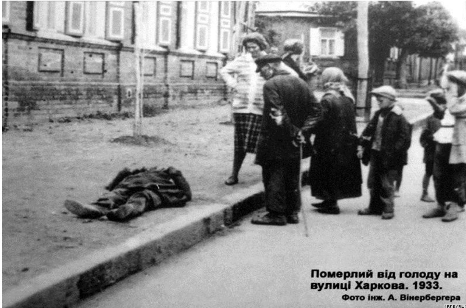
Померлий від голоду на вулиці Харкова. 1933.