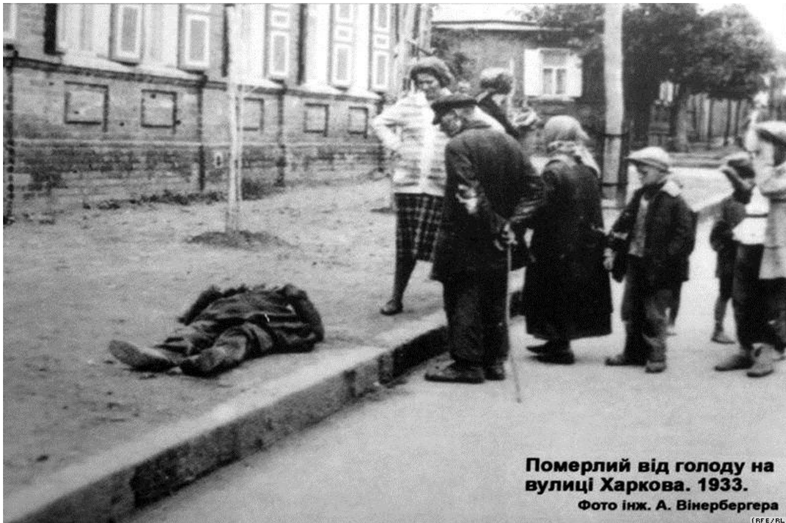
Померлий від голоду на вулиці Харкова. 1933.