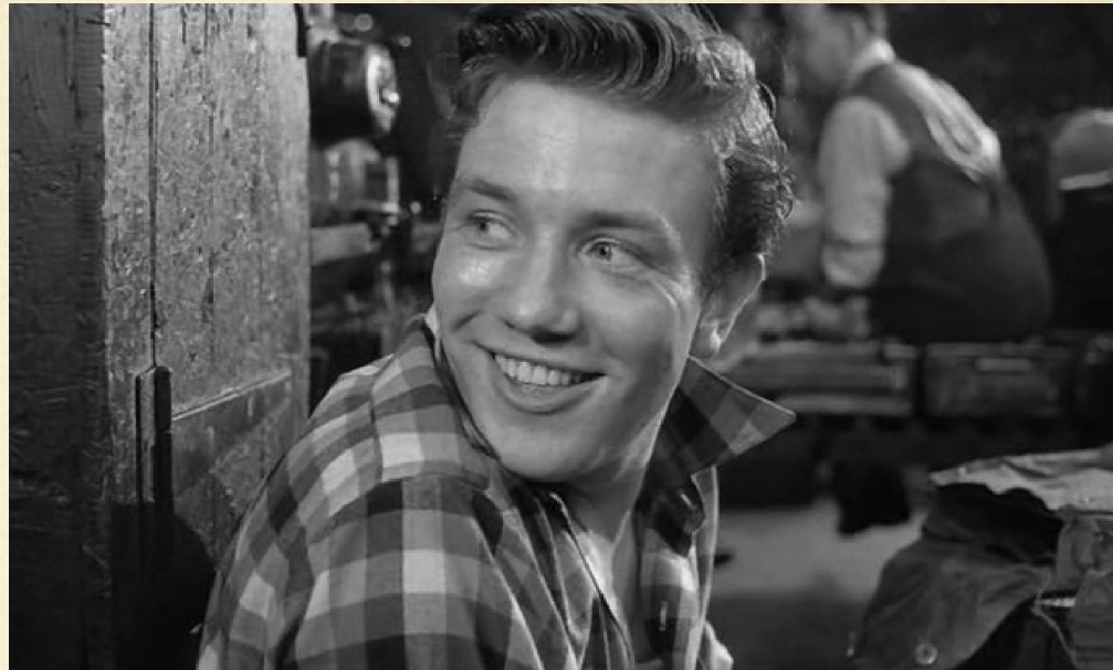
Кадр из к/ф «В субботу вечером и в воскресенье утром»

Произведения: «В субботу вечером и в воскресенье утром»(1958), «Ключ от двери» (1961) А. Силлитоу, «День сардины» С. Чаплина (1961)