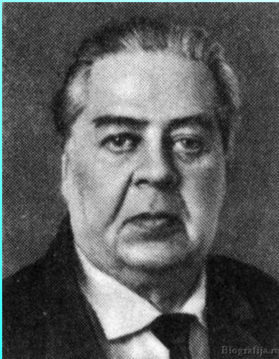
художник Юрий Алексеевич Васнецов