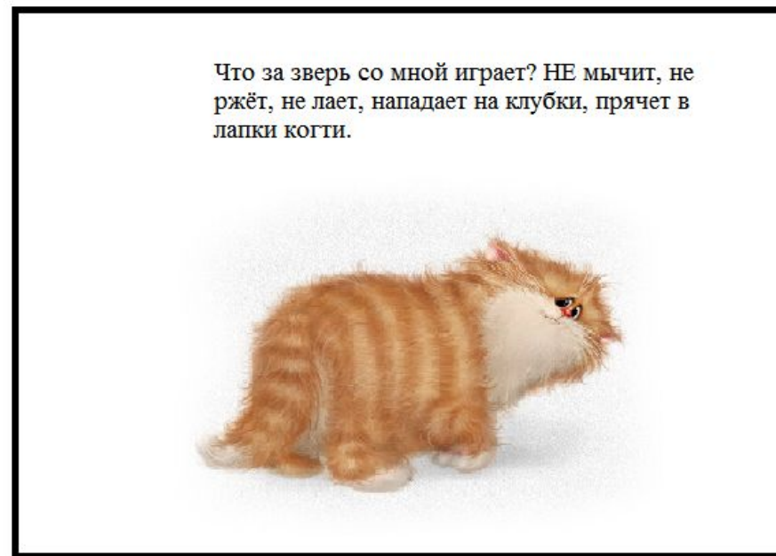
Рис. 6. Готовая работа

В готовом виде работа может выглядеть как показано на рисунке 6.