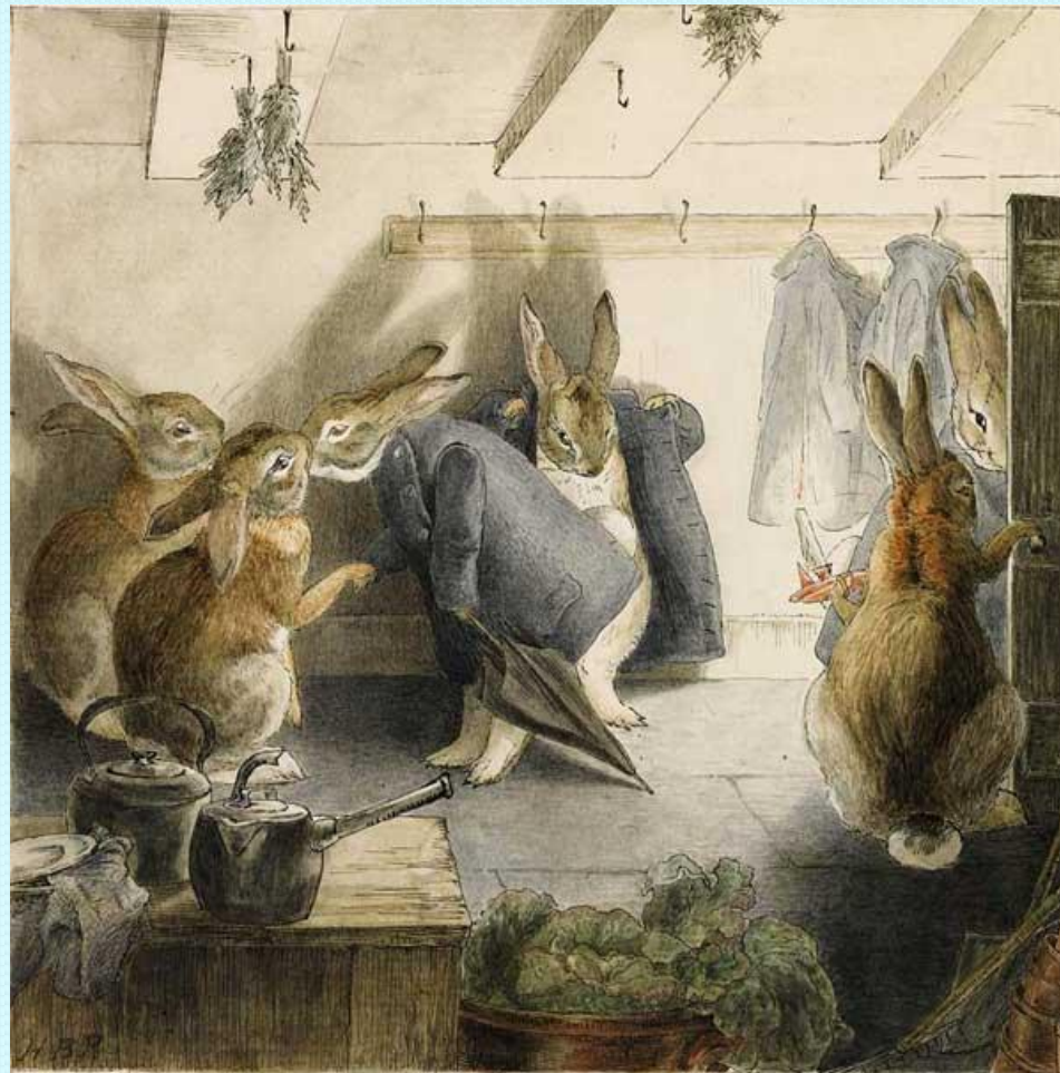
Рис. 7. Иллюстрация к книге Биатрис Поттер «Кролики»