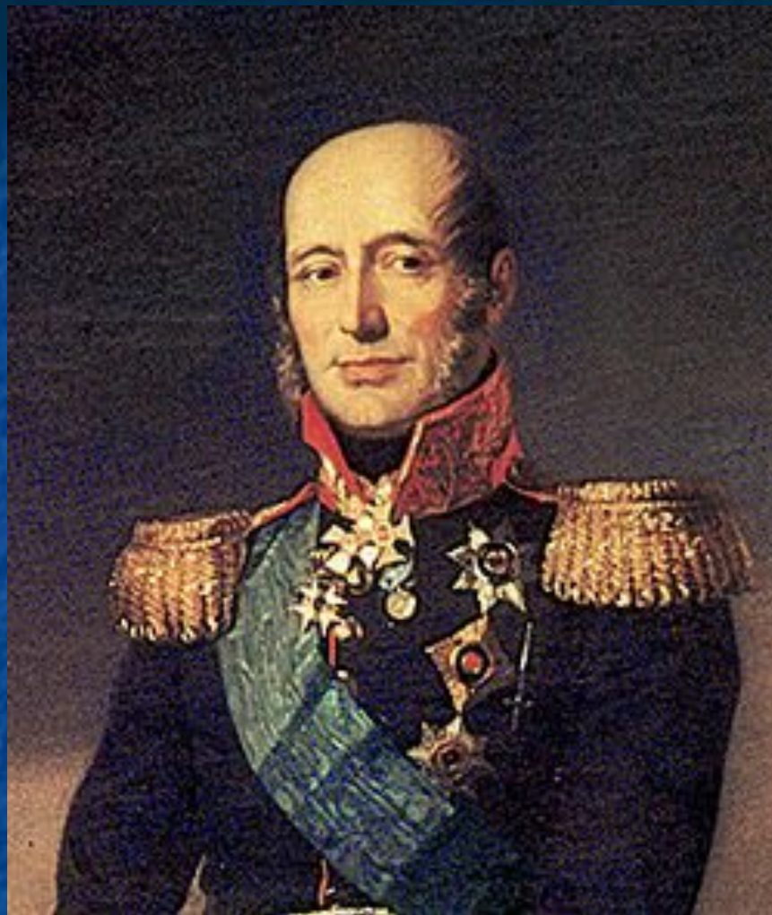
Михаил Богданович Барклай-де-Толли