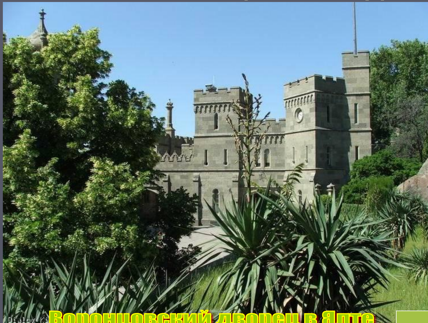
Воронцовский дворец в Ялте