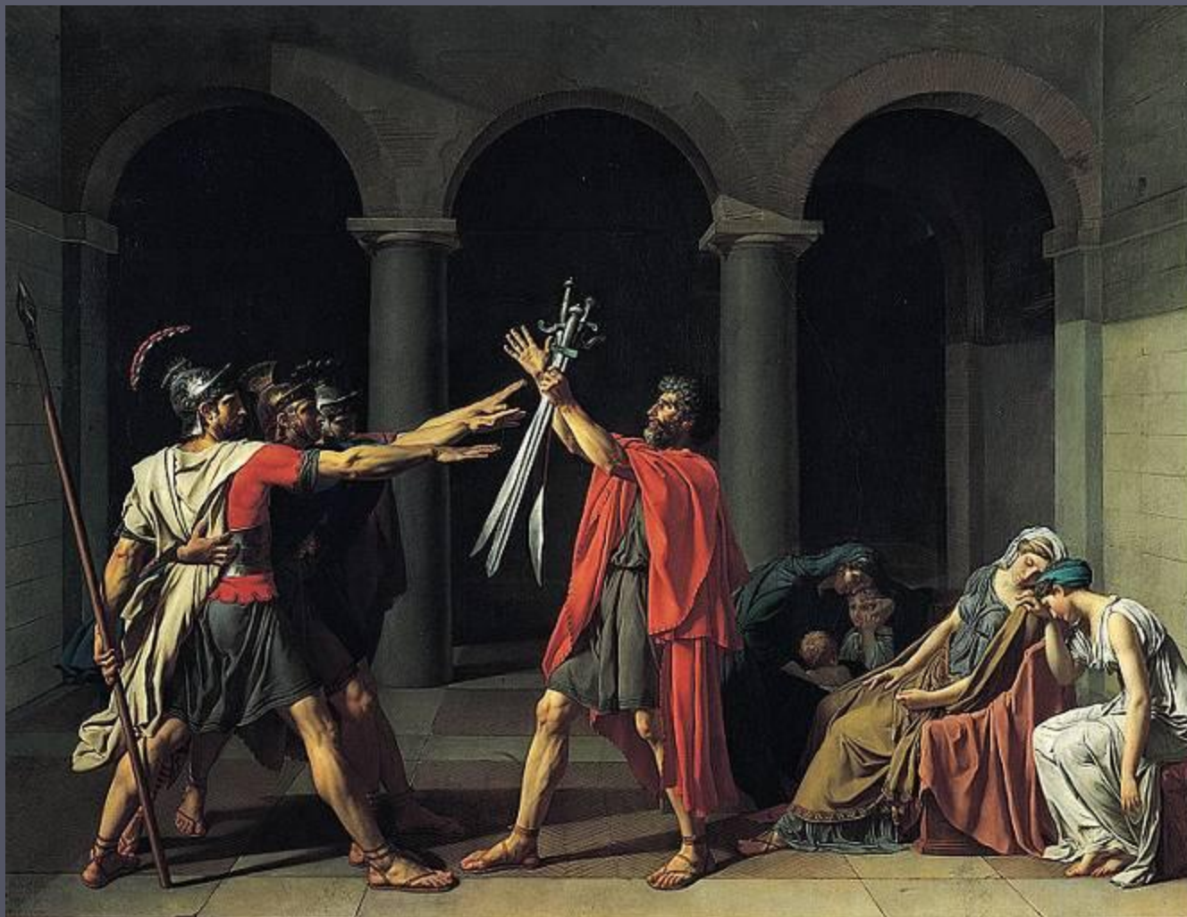
Жак-Луи Давид. Клятва Гораціев