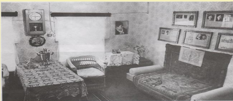
В Доме – музее Ашальчи Оки в селе Алнаш