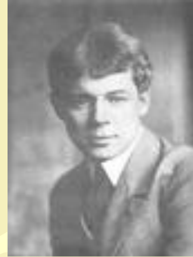
Есенин Сергей Александрович 03.10.1895 года – 28.12.1925 года