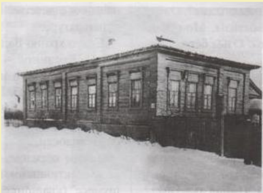
Карлыганскя Центральная вотская (удмуртская) школа