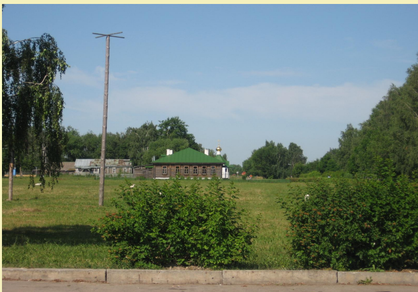
Земская школа, где учился ПОЭТ