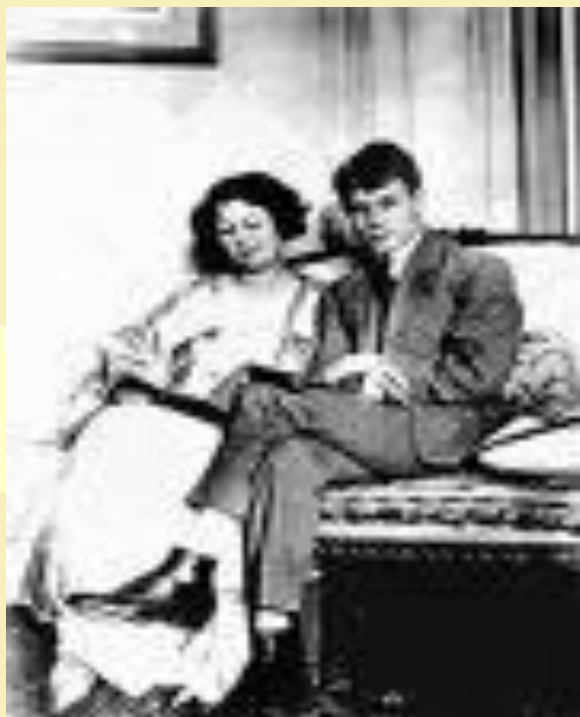
Дункан и Есенин