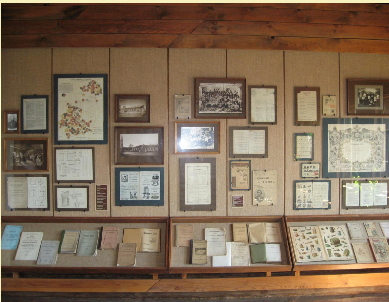
Музей в Константиновской земской школе