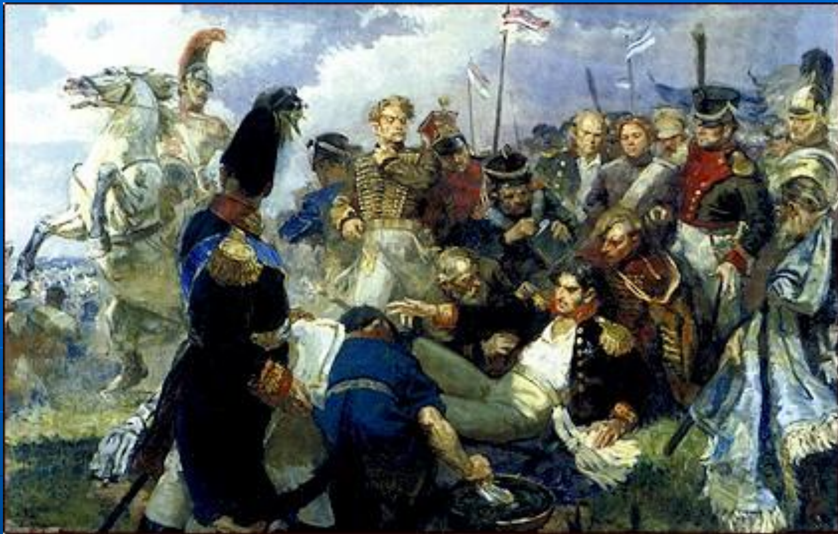
Храбрый генерал Петр Иванович Багратион