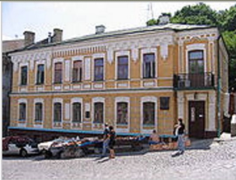
Дом-музей Булгакова в Киеве

В 1926 году во МХАТе поставлена пьеса «Дни Турбиных», В 1927 году Михаил Афанасьевич завершает драму «Бег». С 1926 по 1929 год в Театре-студии Евгения Вахтангова шла пьеса Булгакова «Зойкина квартира», в 1928—1929 год в Московском Камерном театре был поставлен «Багровый остров» (1928). В 1932 году возобновлена постановка «Дней Турбиных» во МХАТе. В 1934 году завершён первый полный вариант романа «Мастер и Маргарита», включающий 37 глав.