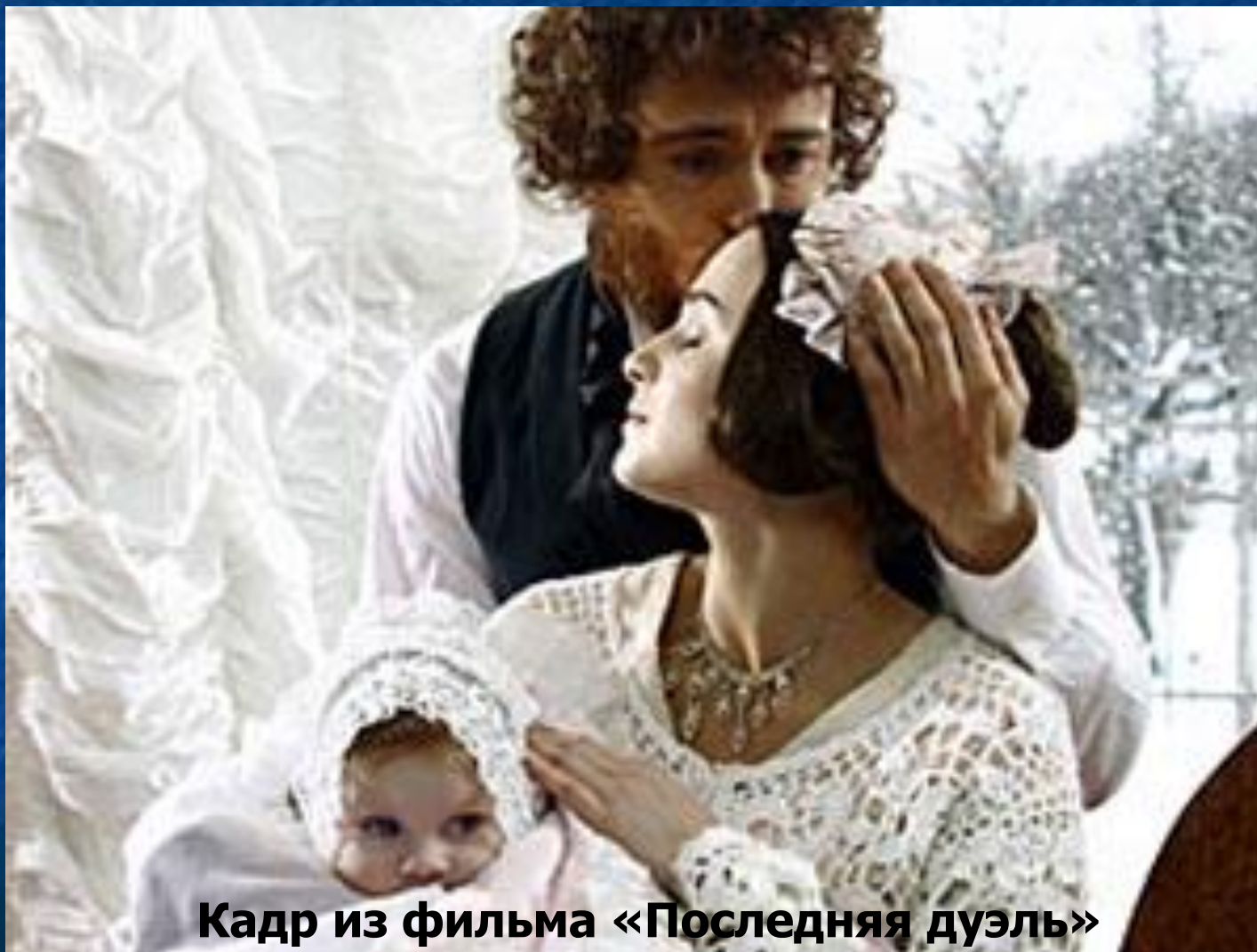
Кадр из фильма «Последняя дуэль»