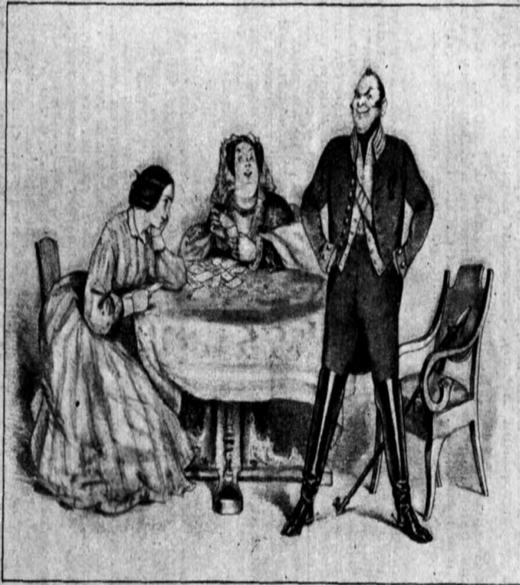
Редисова: Дневн. У. Я. Я. I.