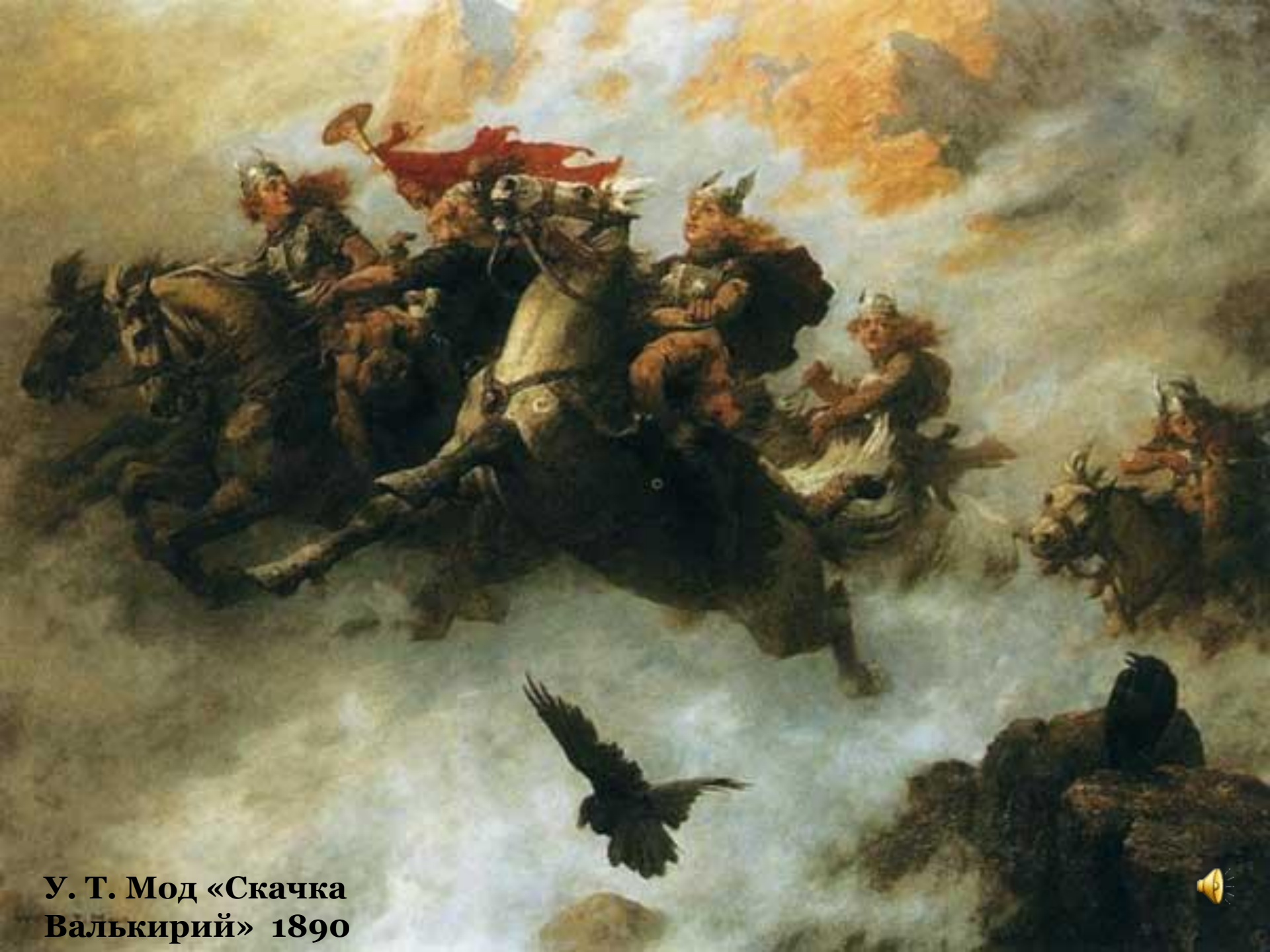
У. Т. Мод «Скачка Валькирий» 1890