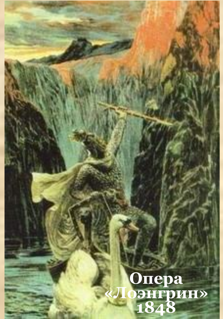
Опера «Лознгрин» 1848