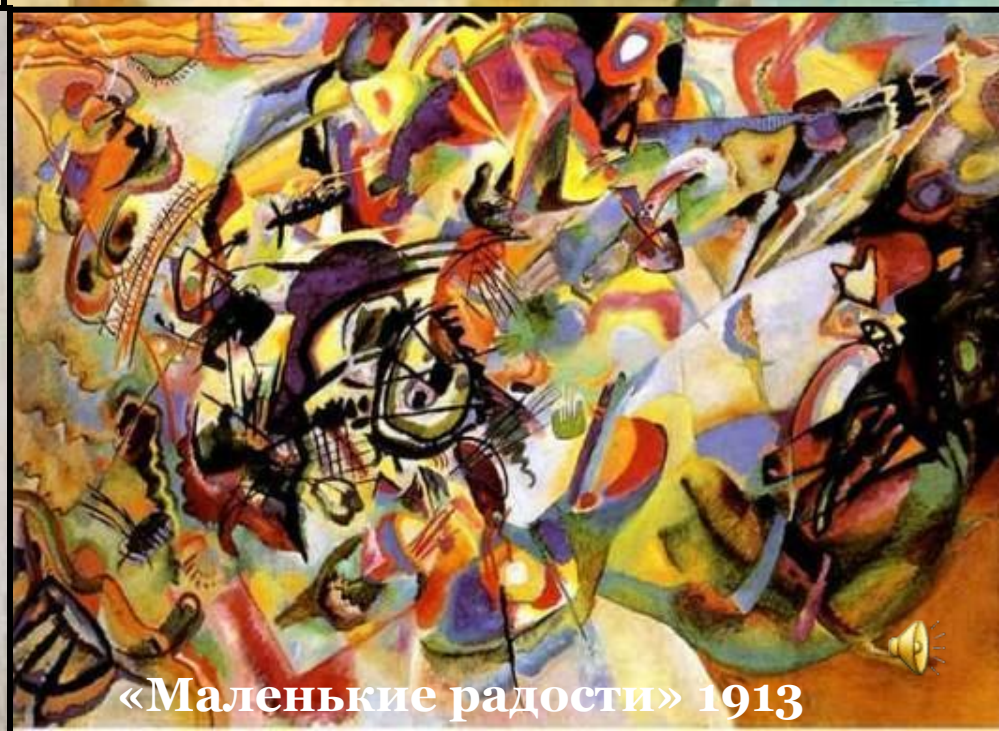
«Маленькие радости» 1913