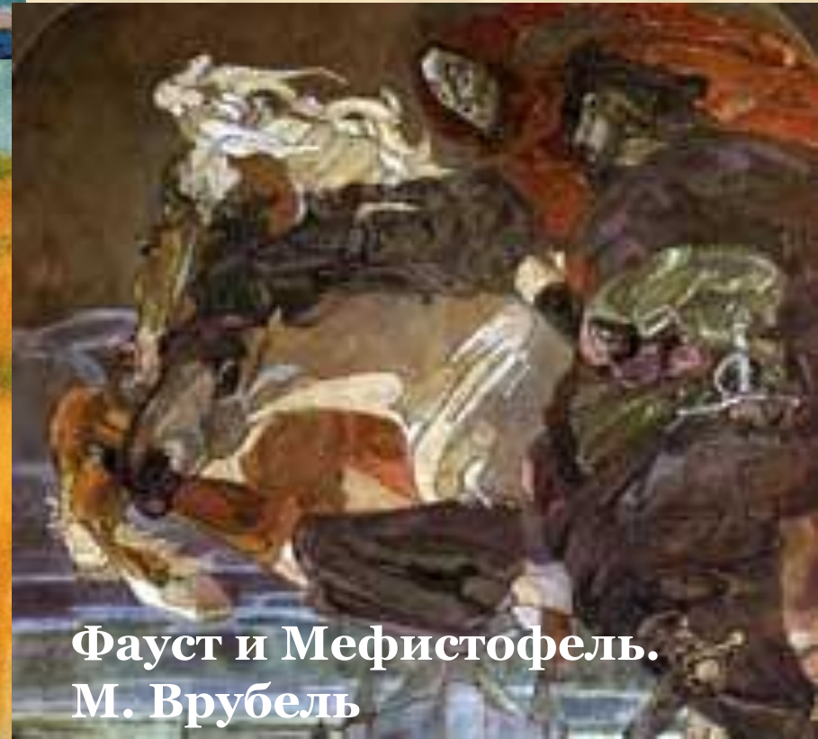
Фауст и Мефистофель. М. Врубель

Почему художники обращаются к аллегории или сюжетам вне времени?