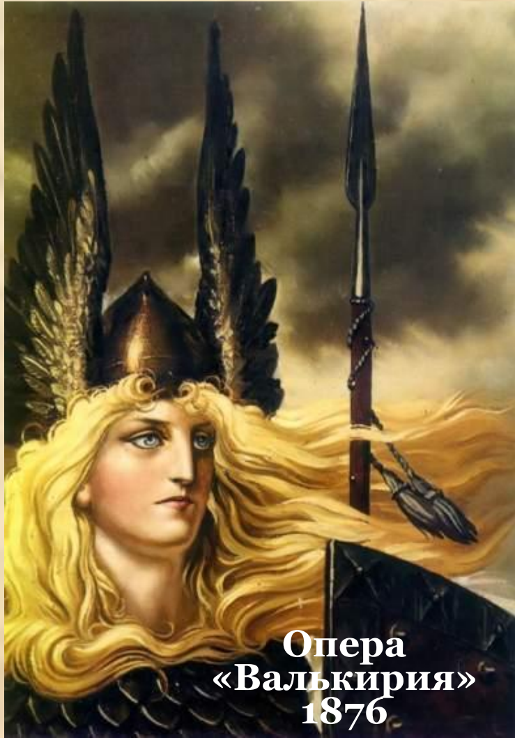
Опера «Валькирия» 1876