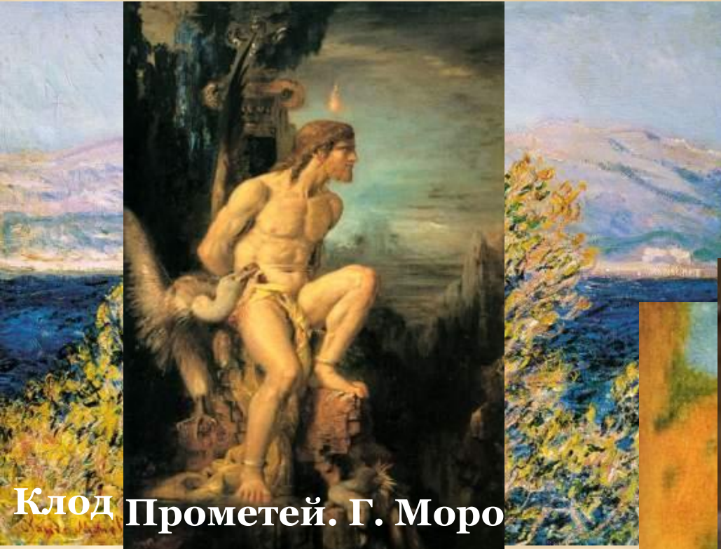
Клод Прометей. Г. Моро

Чем можно объяснить стремление художников уйти от конкретной формы?