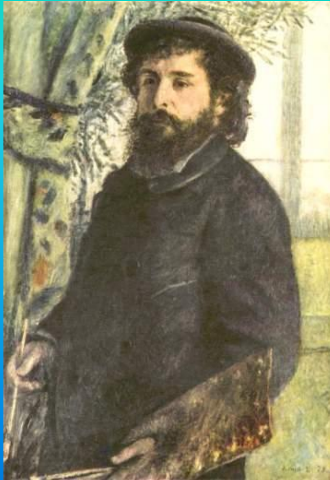
Клод Моне (1840-1926)