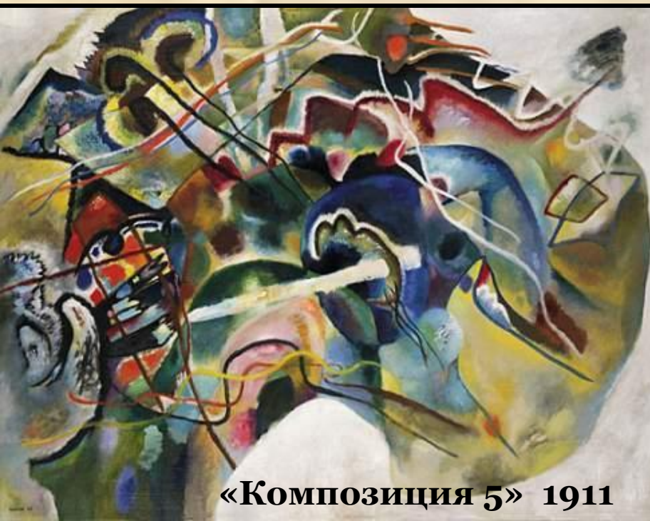
«Композиция 5» 1911