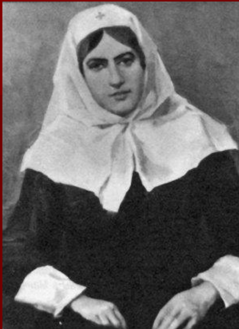
Баронесса Юлия Вревская