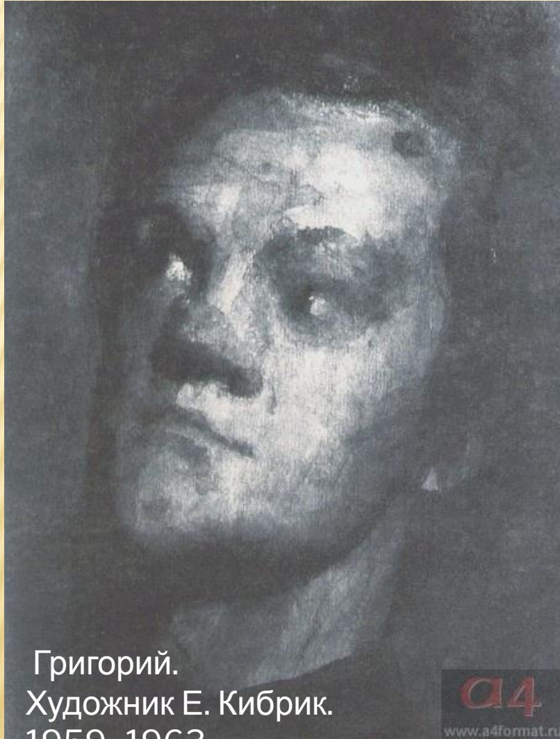
Григорий. Художник Е. Кибрик. 1959–1963