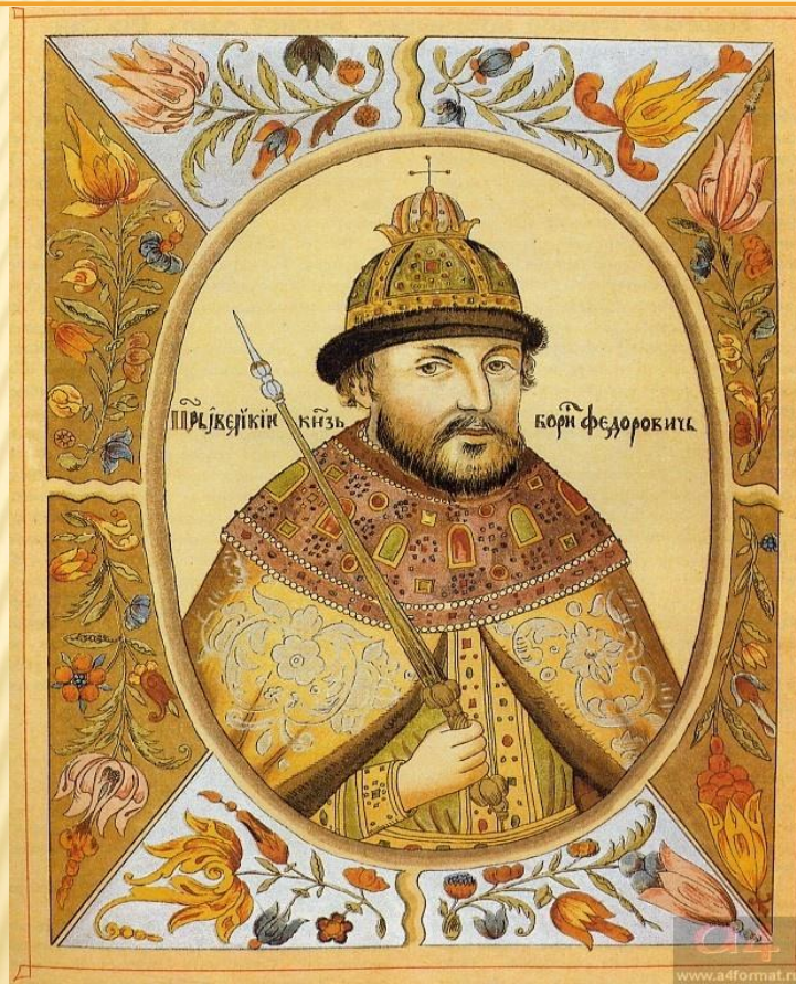
Борис Годунов. Портрет работы неизвестного художника из книги XVII века «Корень Российских государей»

Трагедия «Борис Годунов» создавалась как воплощение мысли Пушкина об «истинном романтизме», т.е. о таком описании жизни, которое сегодня принято называть реализмом. Пушкин воплотил себя не только как поэт, но и как историк.