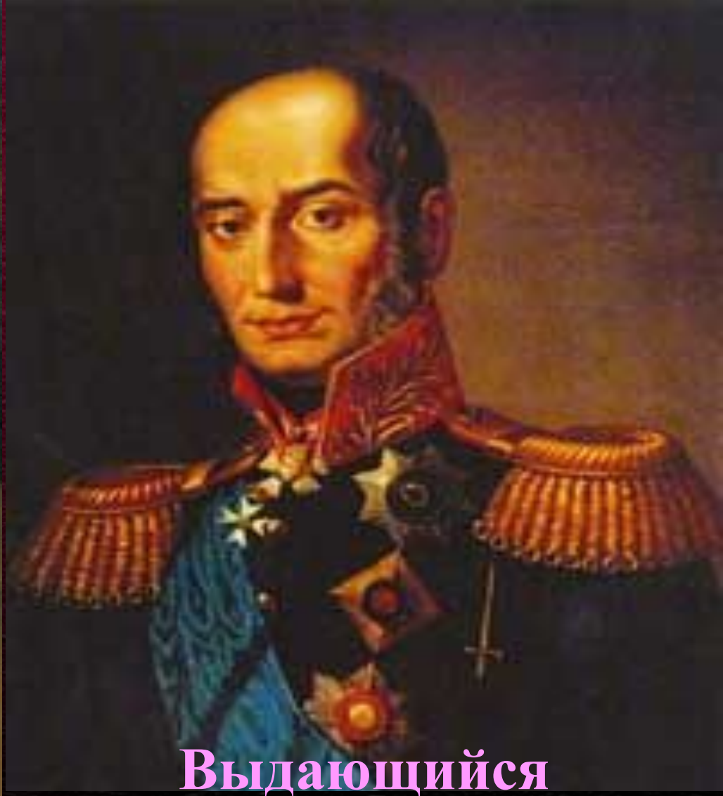
Выдающийся полководец России Барклай де Толли.