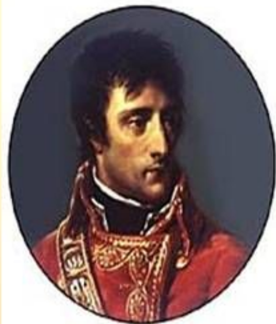
Наполеон Бонапарт – французский государственный деятедь, полководец.