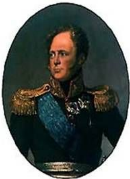
Александр I – российский император.