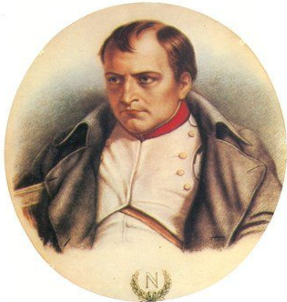
Наполеон I Бонапарт - французский полководец и государственный деятель.