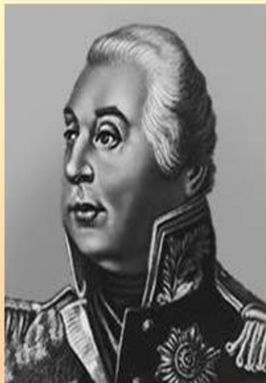
Кутузов Михаил Илларионович – русский полководец.