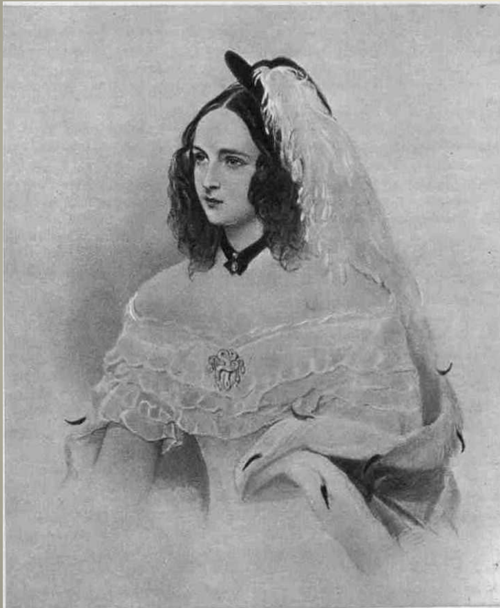
Наталья Николаевна Пушкина.