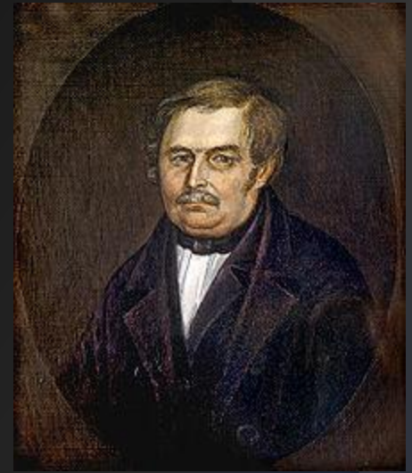
Василий Гоголь-Яновский , отец Николая Гоголя

Николай Васильевич Гоголь родился 1 апреля (20 марта по старому стилю) 1809 г. в селе Большие Сорочинцы на Полтавщине. Родители будущего писателя, Василий Афанасьевич Гоголь-Яновский и его жена Мария Ивановна, были помещиками среднего достатка. По отцовской линии род Гоголь вел свое происхождение от казацкого полковника Остапа Гоголя. Соратника гетмана Петра Дорошенко. По материнской - имел далекие родственные связи с Мазепой, Павлом Полуботком и Семеном Палием.