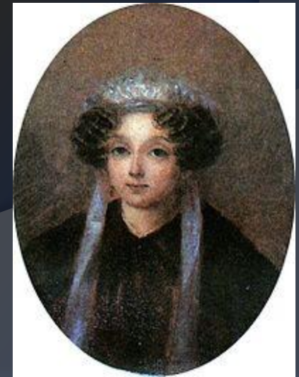
Мария Ивановна Гоголь-Яновская , мать писателя