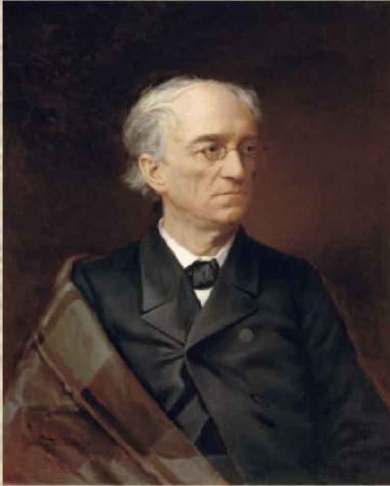
И.Ф.Александровский. Портрет Ф.И.Тютчева

В последние годы жизни Тютчев написал около пятидесяти стихотворений. Самые известные среди них: «Накануне годовщины 4 августа 1864 года» (1865), «Умом Россию не понять...» (1866), «Нам не дано предугадать...» (1869), «Я поздно встретился с тобою...» (1872) и др.