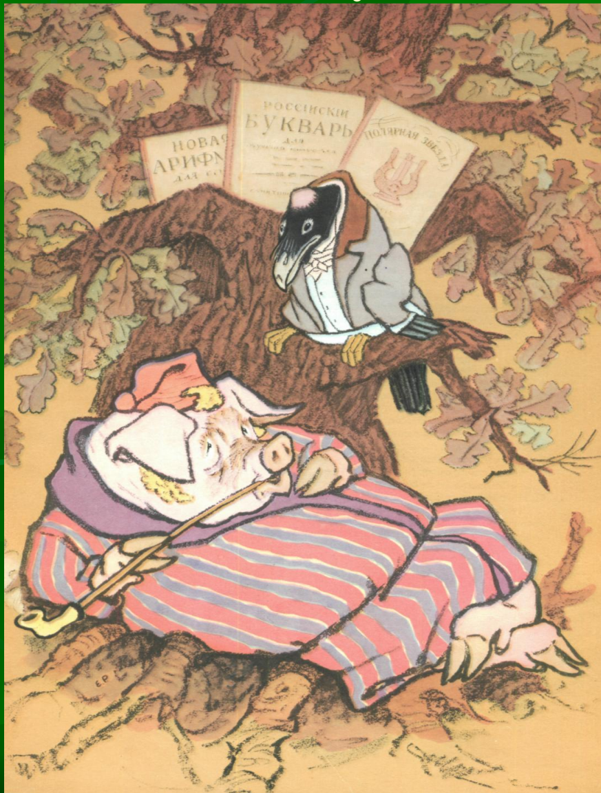
Иллюстрация басни И.А.Крылова «Свинья под дубом»