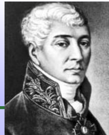
Иван Иванович Дмитриев

Дмитриев значительно преобразует традиционный жанр. Его басни лишены социальных мотивов и сатирического элемента. Поэт призывает довольствоваться тем, что они имеют и не роптать на судьбу.