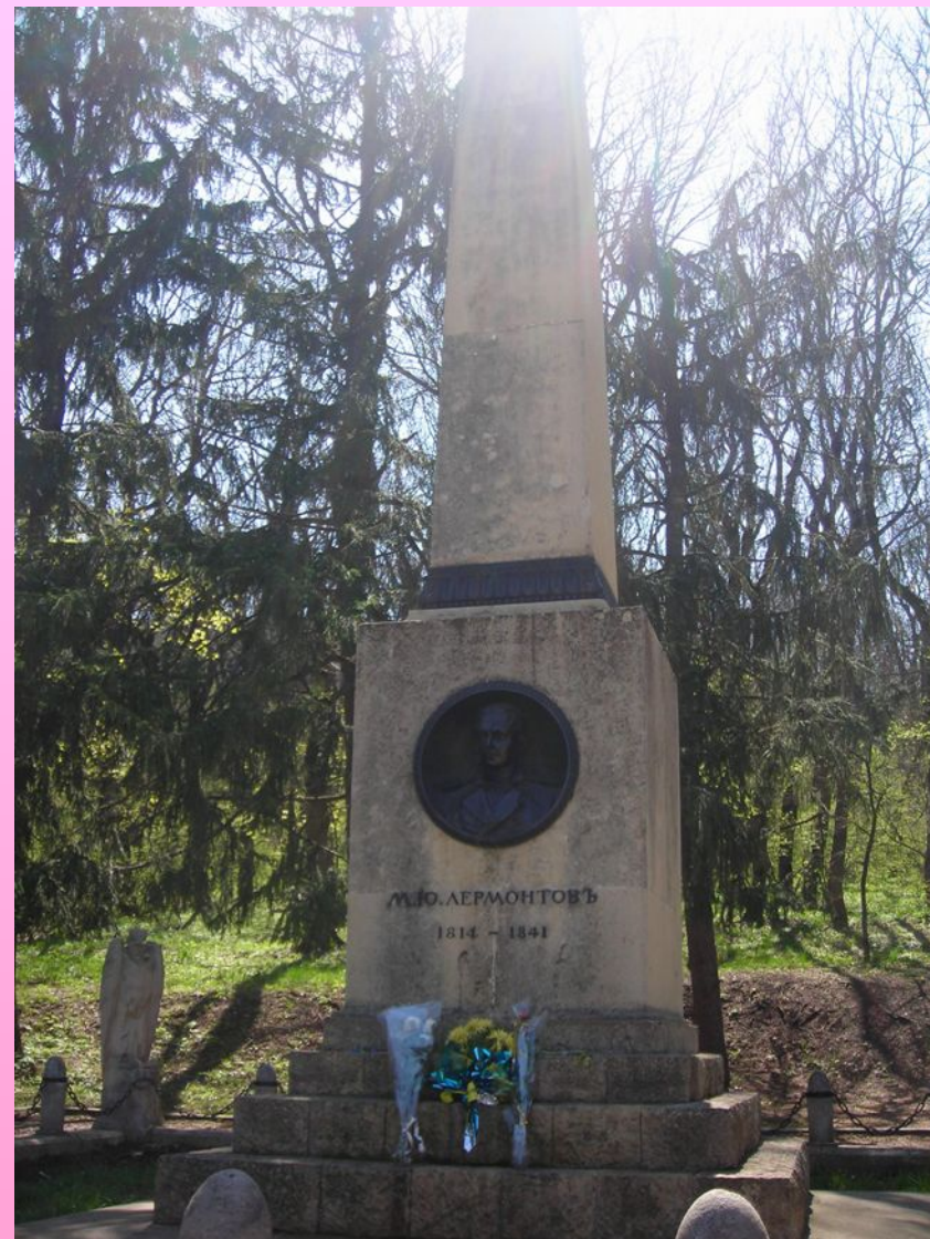
Памятник М.Ю. Лермонтову на месте дуэли