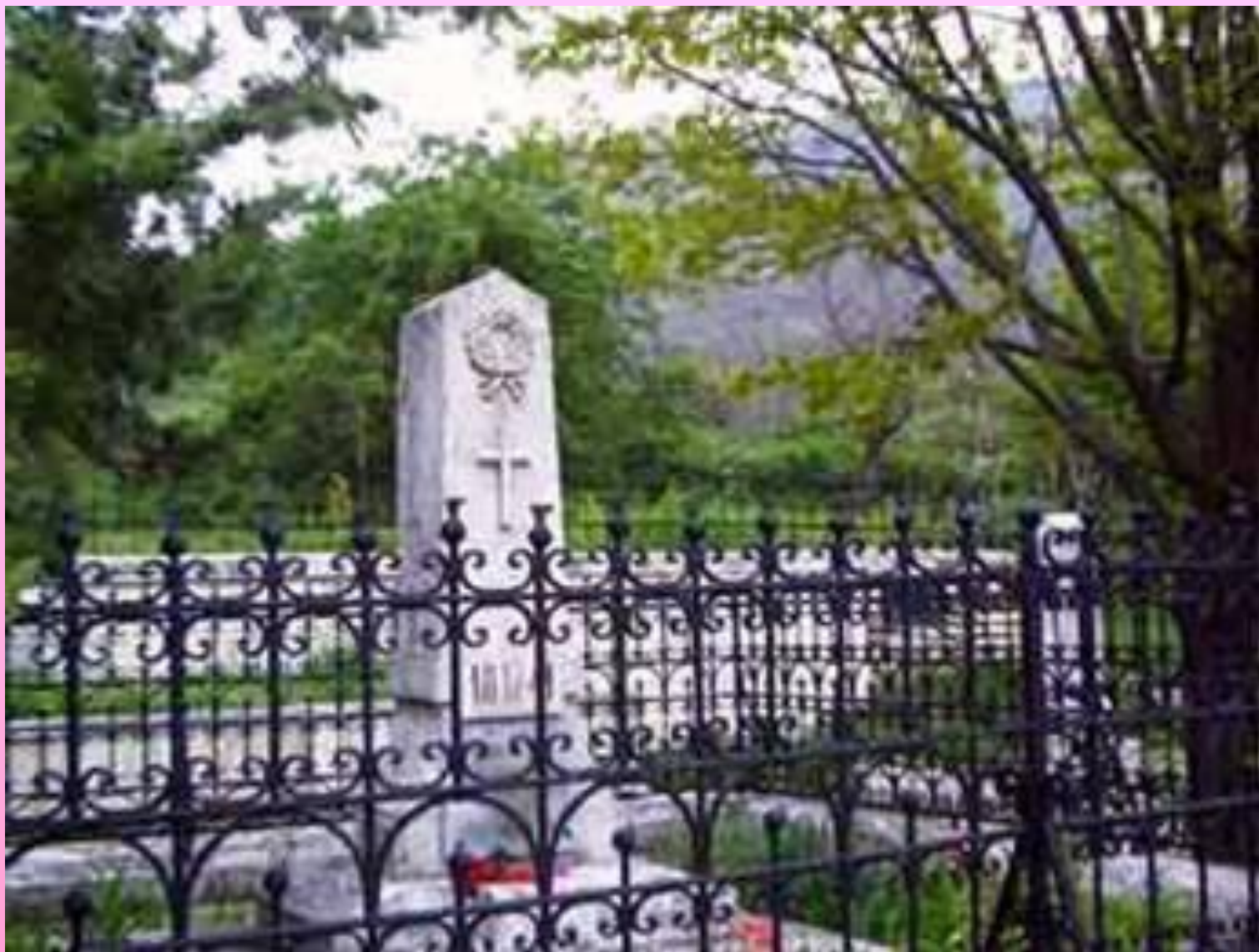
Место первоначального погребения Лермонтова в Пятигорском некрополе