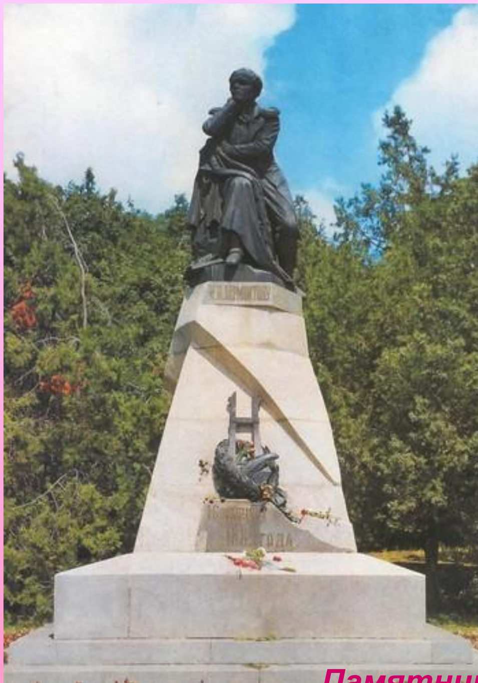
Памятник в Пятигорске