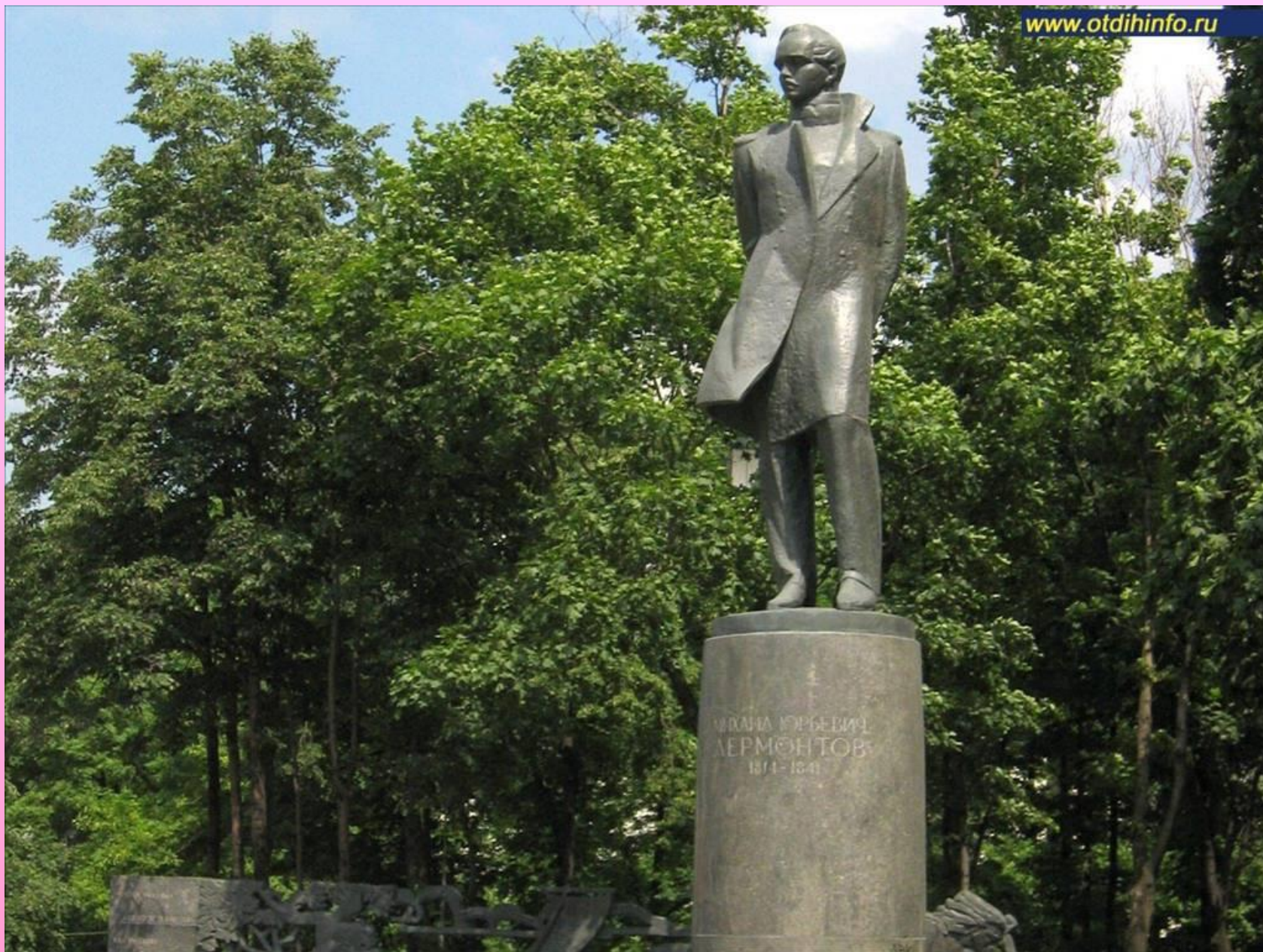
Памятник в Москве