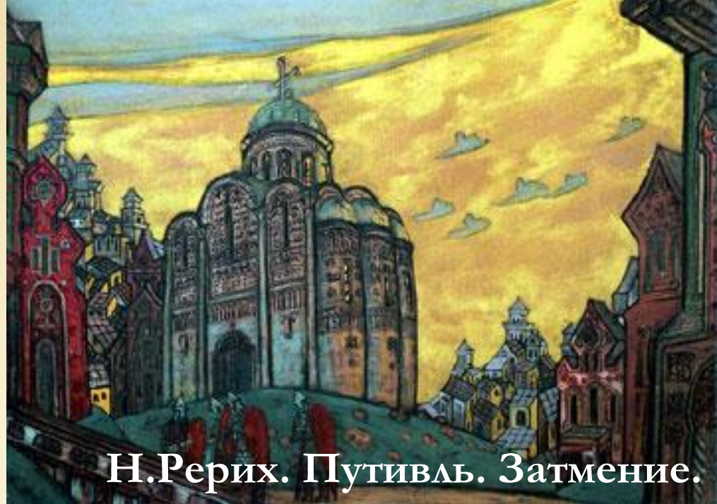
Н.Рерих. Путивль. Затмение.