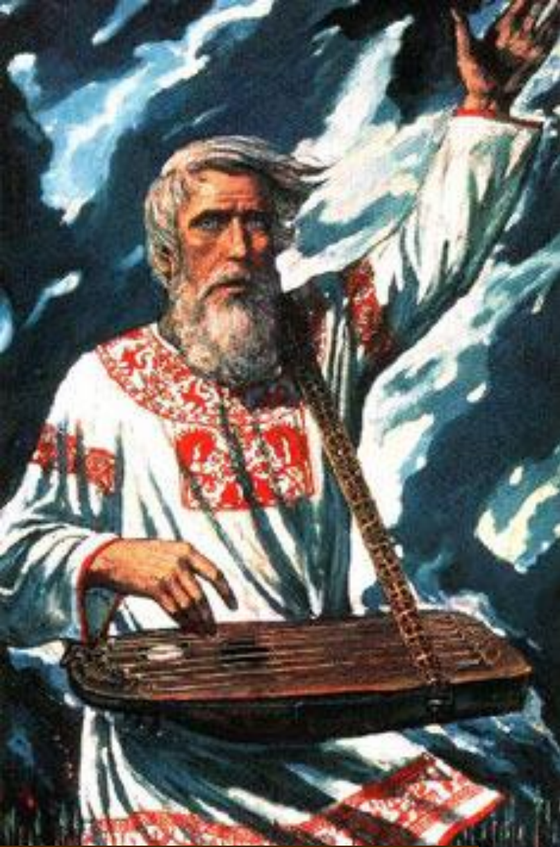
И.Глазунов. Боян. Слава предкам!