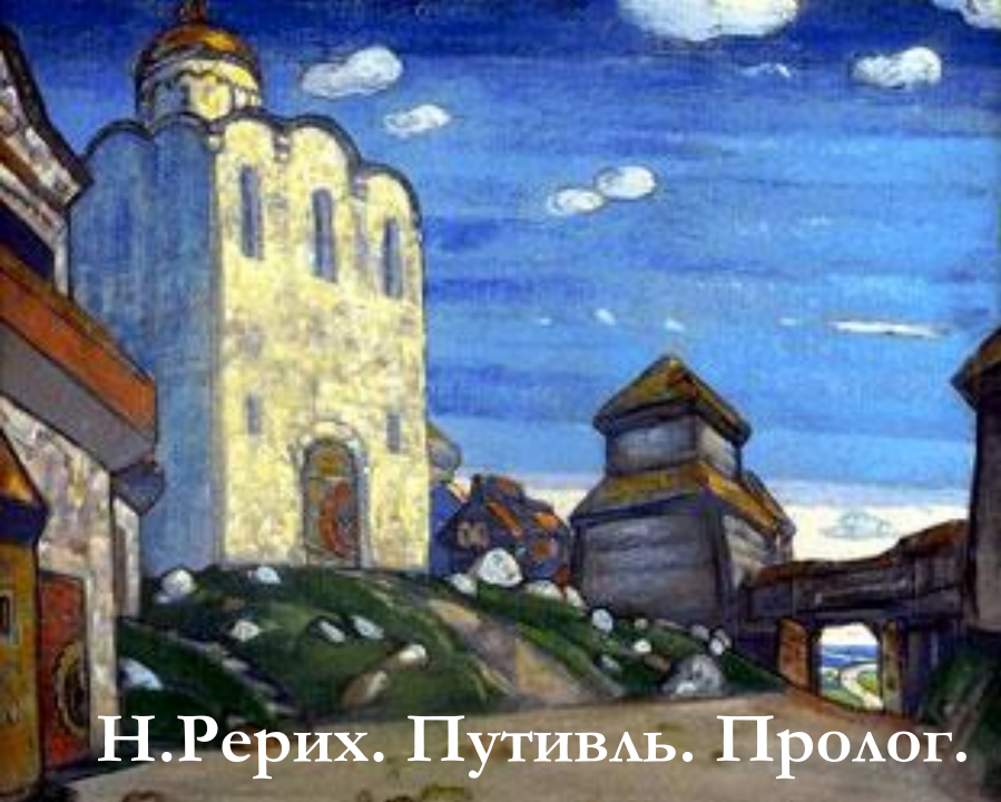
Н.Рерих. Путивль. Пролог.