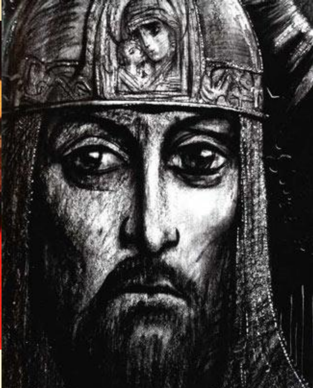
И.Глазунов. Князь Игорь. 1962, 1973