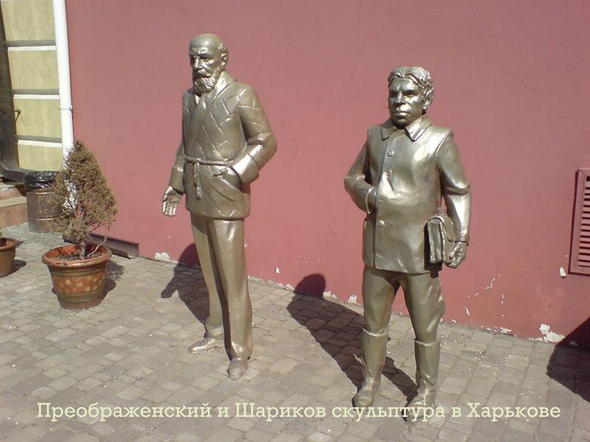
Преображенский и Шариков скульптура в Харькове