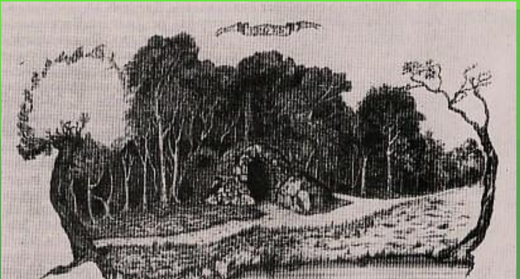
ГРОТ ОТДОХНОВЕНИЯ В ПАРКЕ