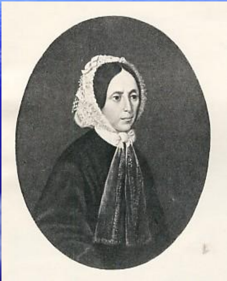
Мария Ивановна Гоголь-Яновская, мать писателя