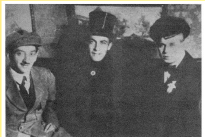
41. С.А.Есенин, А.Б.Мариенгоф, Г.Б.Якулов. 1919.