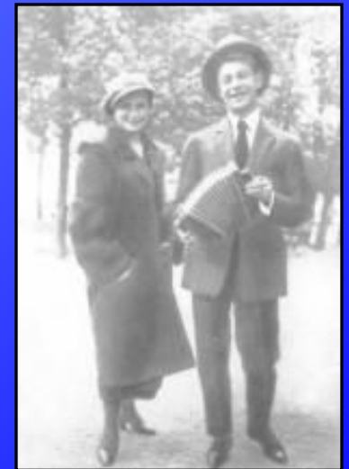
Есенин с сестрой