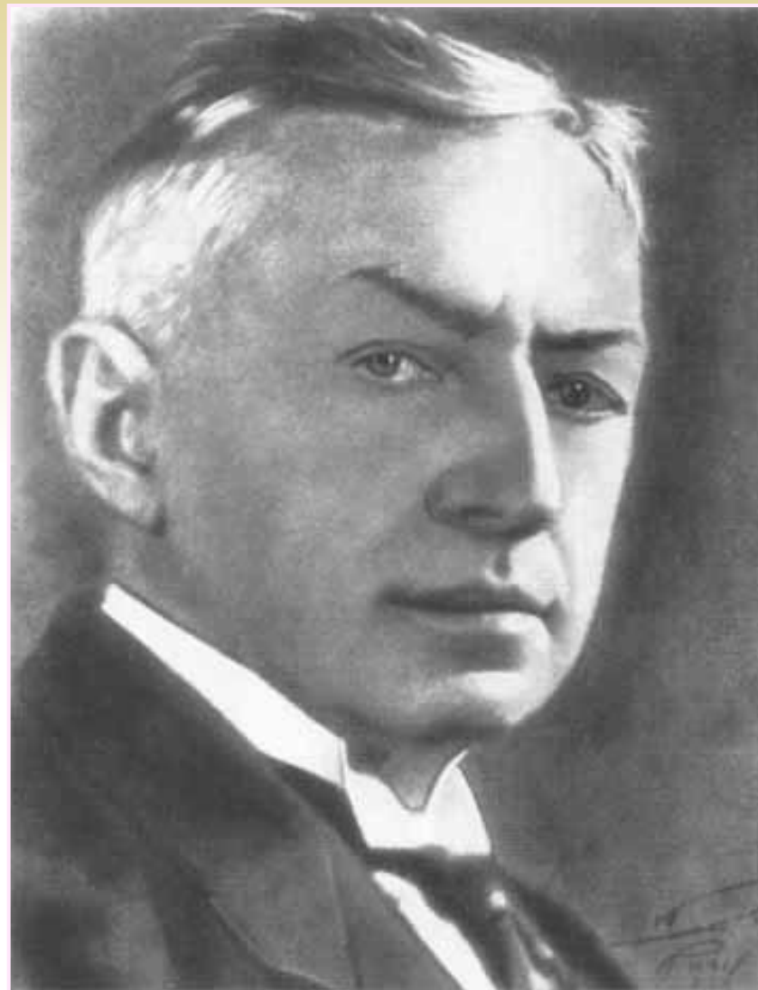
Бунин Иван Алексеевич (1870-1953)